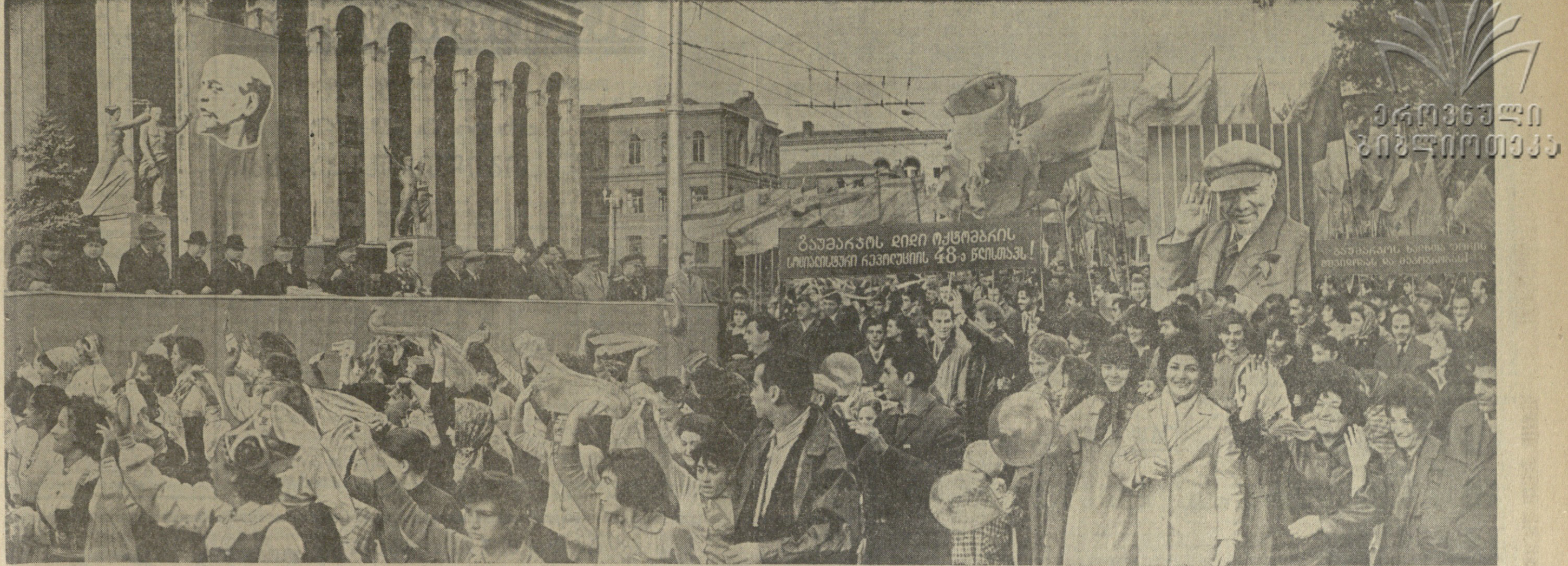
თბილისი, 1965 წლის 4 ნოემბერი. ახალი მშენებელი ფარგონების დემონსტრაციის მონაწილეები მიმდინარეობს ქალაქის პარკში.