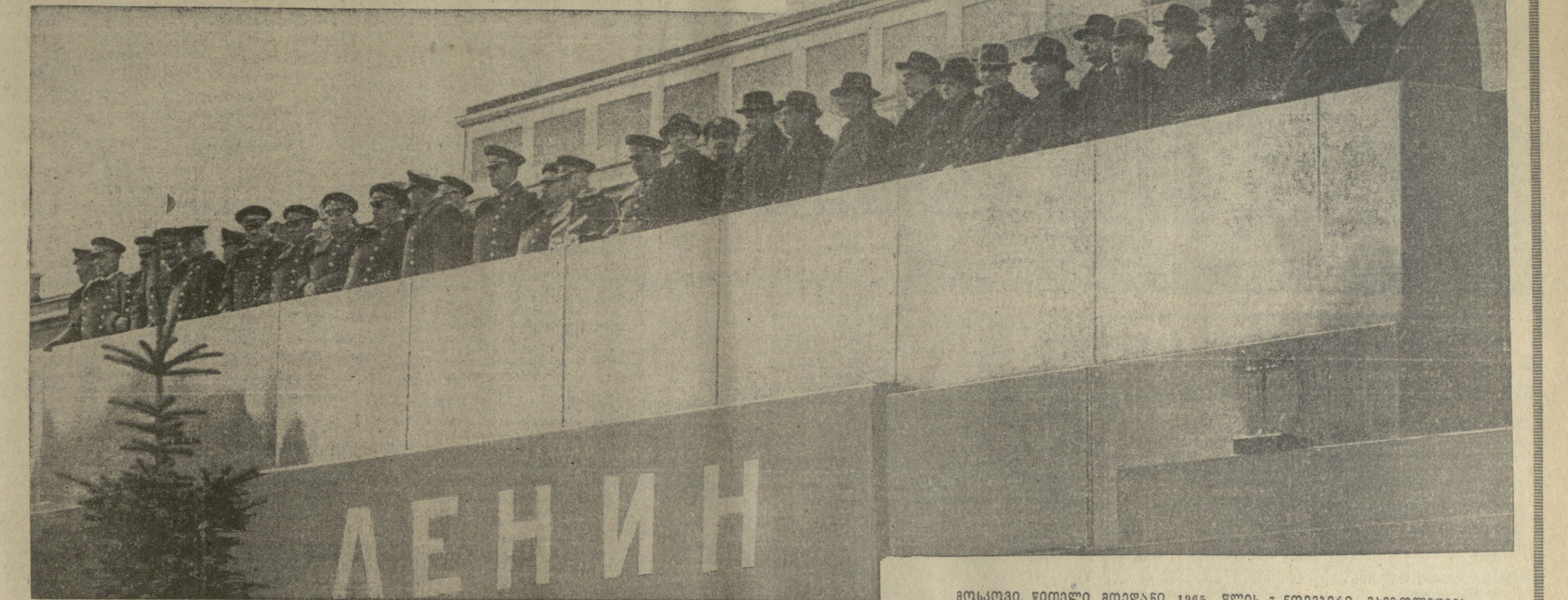
მოსკოვი, წითელი მოედანი, 1965 წლის 7 ნოემბერი. მავოილუვის ცენტრალური ბრიგადა.