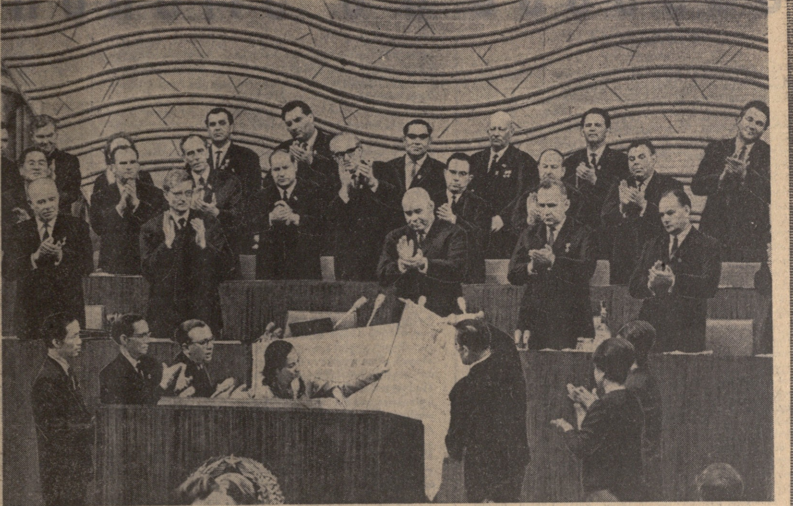
მოსკოვი. საბჭოთა კავშირის კომუნისტური პარტიის XXIII ყრილობის დღეებში მსხვერპლად შეხვედნენ სამხრეთ ვიეტნამის განთავსულების ეროვნული ფრონტის ცენტრალური კომიტეტის წევრს ამახანგ ზუნგ თხი ბინს, როცა იგი ტრენინგზე გამოჩნდა. მან ყრილობის პრეზიდიუმს გადასცა დროშა, როგორც სამხრეთ ვიეტნამის მებრძოლი ხალხისა და საბჭოთა კავშირის ხალხების სოლიდარობისა და ურთველი მეგობრობის სიმბოლო.