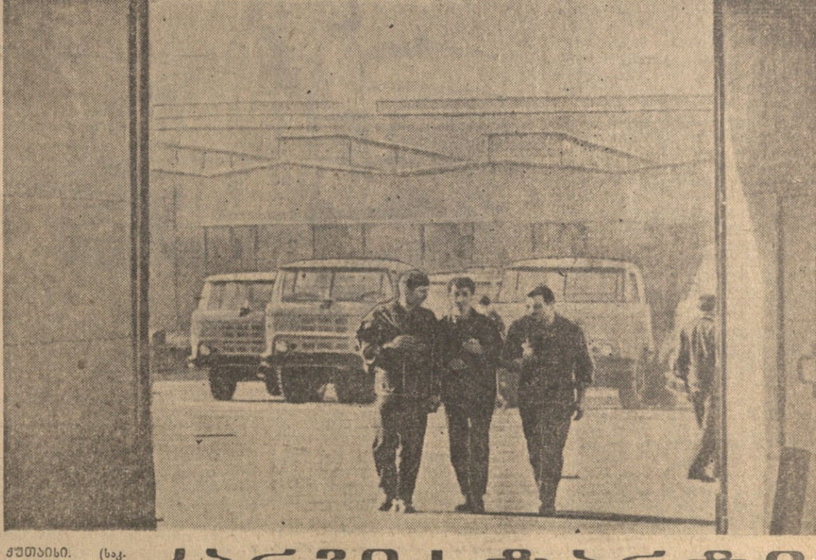
საბჭოთაო სახალხო რევოლუციის 47-ე წელიწადის დასაწყისში...