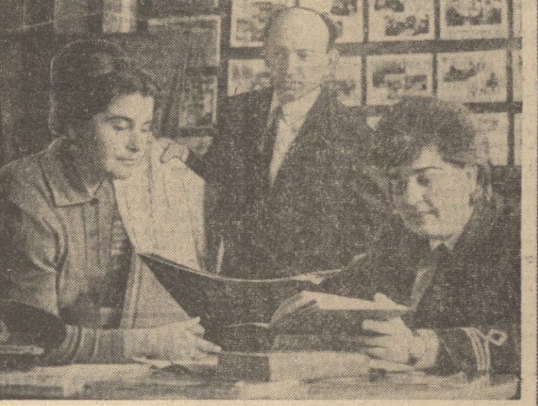
ბათუმის სახალხო ანგარიშის განყოფილებაში