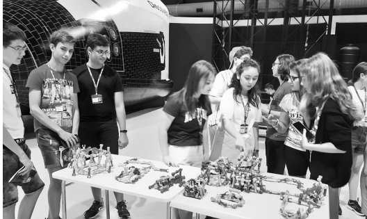
ბულ შტატებსა და კანადაში. პროექტი ხორციელდება აჭარის ავტონომიური რესპუბლიკის განათლების, კულტურისა და სპორტის სამინისტროს ფინანსური მხარდაჭერით

ამ ბანაკის მიზანია ახალგაზრდების მეცნიერებითა და ტექნოლოგიებით დაინტერესების ხელშეწყობა. აქ მიღებული გამოცდილება მოსწავლეებს ენმარება გუნდური მუშაობის, კომუნიკაციისა და პრობლემების გადაწყვეტის უნარების განვითარებაში. ბანაკში სამეცნიერო პროგრამა ინგლისურ ენაზე ხორციელდება და მასში მსოფლიოს სხვადასხვა ქვეყნის წარმომადგენლები მონაწილეობენ. 2011 წლიდან დღემდე, სამეცნიერო ბანაკში აჭარის რეგიონის სკოლებიდან 120 მოსწავლე ჩაერთო.