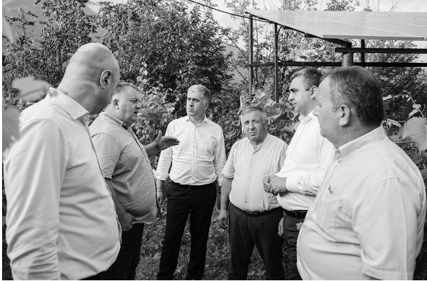
ქტს ახორციელებს. ჩვენ ვეხმარებით ფერმერებს წარმოების ზრდაში, ახალი ტექნოლოგიების დანერგვასა და ასევე, საწარმოების შექმნაში. რაშიც მნიშვნელოვანია, აქტიურად ჩაერთონ მეწარმეები, ფერმერები. ეს ხელს უწყობს ქვეყანაში სოფლის მეურნეობის განვითარებას. ასევე მნიშვნელოვანია, რომ ევროკავშირის დახმარებით, სოფლად ისეთ

- სოფლის მეურნეობის განვითარებისთვის სახელმწიფო არაერთ მნიშვნელოვან პროე-