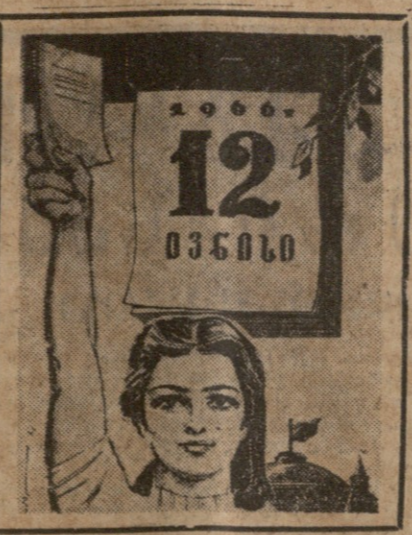
უ. ახლი კი ახალი დადგენილებით რეალური პრობლემები აჩვენებს

№ 126 (13520) პარასკევი, 3 ივნისი, 1966 წ. ფასი 2 კაპ.