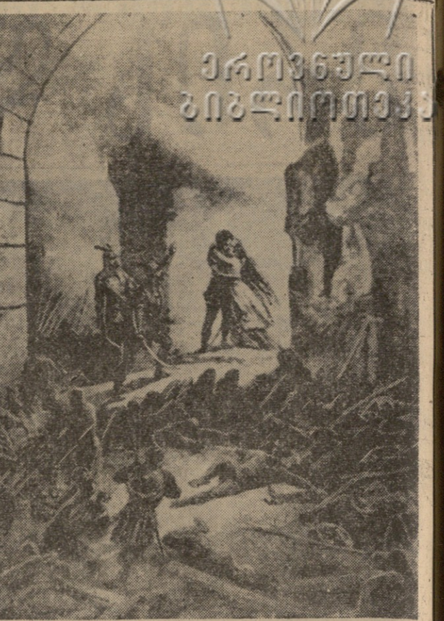
ნახეს, წინა შესარულად გამოეშვა მთავარ გველს...