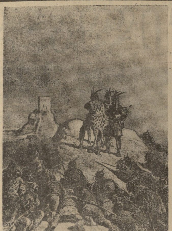
თქვენს, ივითობით, ვითა ვქმნათ, აქ გამორჩევა მწიღია...