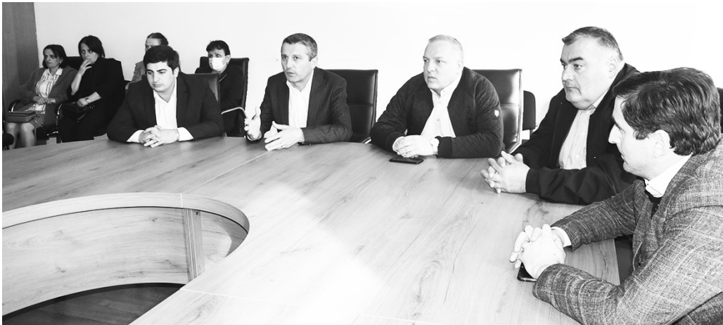
ლებს, სოფელ დაბაძველის სარწყავი არხის დაზიანებული და დამეწყრილი მონაკვეთების შეკეთება, ბესელაშვილებში გზის რეკონსტრუქცია, მიწის კერძო საკუთრებაში დაკანონების დაჩქარება, ოქრობილაურში მისასვლელ ხიდან გზის გაფართოება ითხოვეს. - საინტერესო და შინაარსიანი შეხვედრა