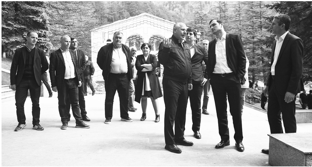
ეს შეუდგენენ. თვალის ერთი გადავლებითაც ცხადია, რომ აქტიურად მუშაობენ და კონკრეტულ ვადებში დაასრულებენ სამუშაოებს, - თქვა მთავრობის თავმჯდომარემ.

- ხანგრძლივმა ზამთარმა ყველაფერს უარყოფითი კვალი დააჩნია. მშენებლებსაც სათანადო პირობები არ ჰქონდათ, აპრილიდან კი საქმე