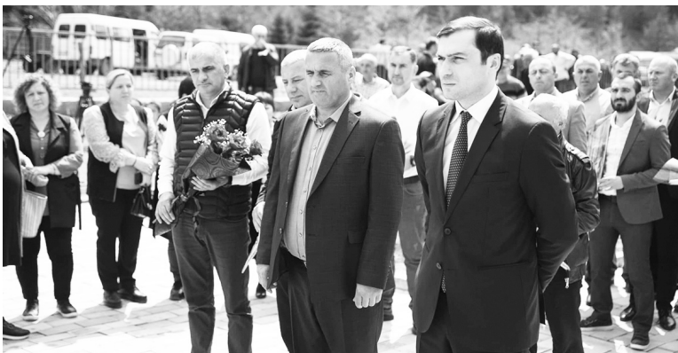
ტივი მიაგო. მათ გვირგვინითა და ყვავილებით შეამკეს მემორიალური დაფები. სოლოგომანის მთის ჩამოშლას 23 ადამიანის, მათ შორის

19 აპრილს აჭარის მთავრობის თავმჯდომარე თორნიკე რიჟვაძე ტრაგედიის ადგილზე რეგიონის, ხულოს მუნიციპალიტეტის აღმასრულებელი და წარმომადგენლობითი სტრუქტურების ხელმძღვანელებთან ერთად მივიდა და სტიქიის შედეგად დაღუპულთა ხსოვნას პა-