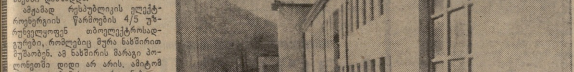
პრეზიდენტის უფლებამოსიების ხელშეწყობის საკითხი