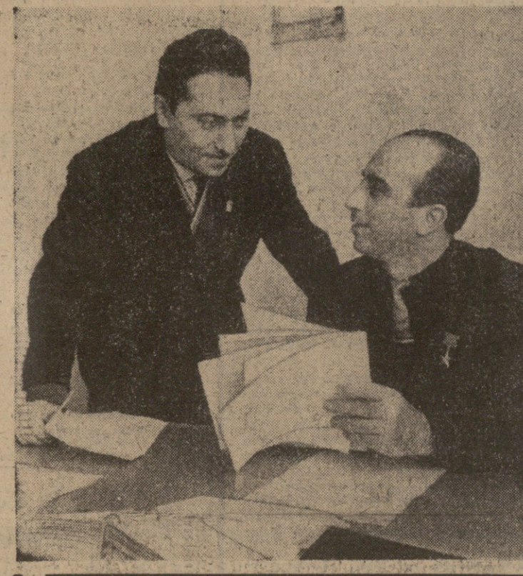
საბერძნეთის დელეგაციის წევრები დასახლებულნი იყვნენ საბერძნეთის დედაქალაქში ათენის ცენტრალურ საბერძნეთის დელეგაციის დასახლებაში.

ბათუმის საბერძნეთის დელეგაციის ვადადეი წევრები საბერძნეთის დელეგაციის წევრების დასახლებაში. დელეგაციის წევრები დასახლებულნი იყვნენ საბერძნეთის დედაქალაქში ათენის ცენტრალურ საბერძნეთის დელეგაციის დასახლებაში.