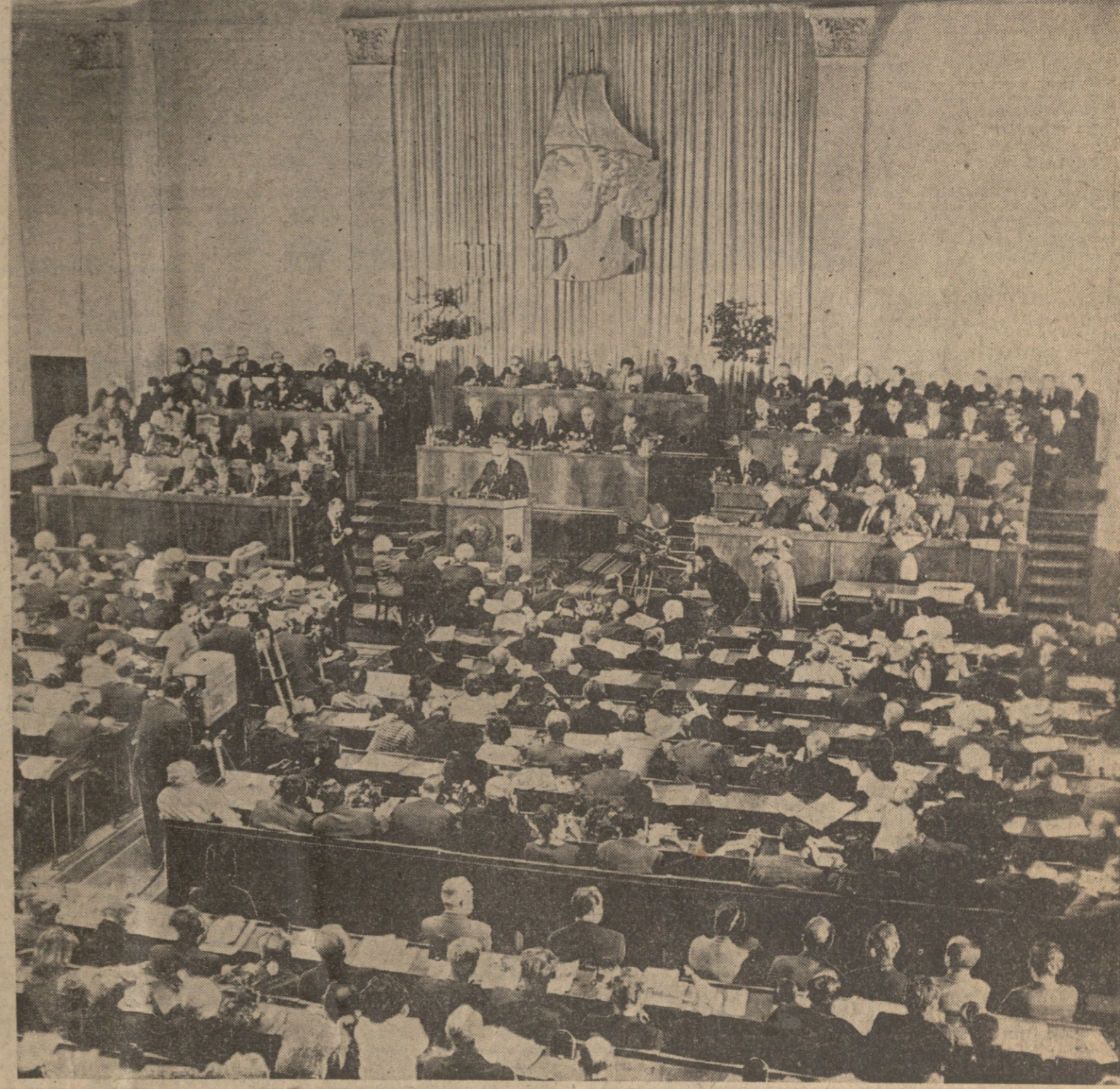
საბჭოში: საქართველოს კომუნისტური პარტიის ცენტრალური კომიტეტის, საქართველოს სსრ უმაღლესი საბჭოს პრეზიუმისა და მინისტრთა საბჭოს სესიონი ხდება საქართველოს სსრ უმაღლესი საბჭოს სხდომა დარბაზში.