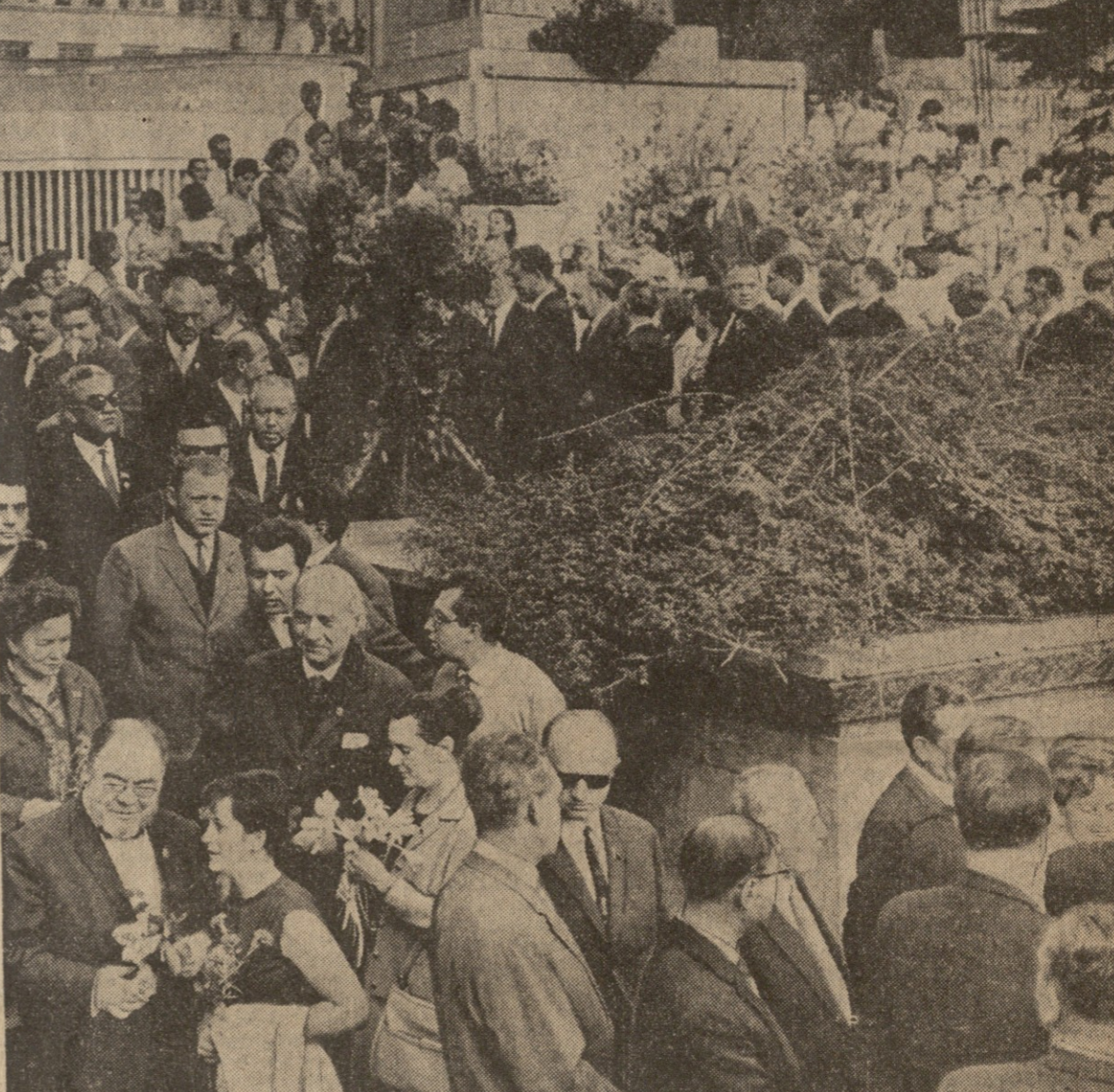
ტიბონი, 1966 წლის 30 სექტემბერს: სურათი: რესპუბლიკის მშრომელთა წარმომადგენლები, საბჭოთა უცხოეთის სტუმრებთან შოთა რუსთაველის ძეგლის...