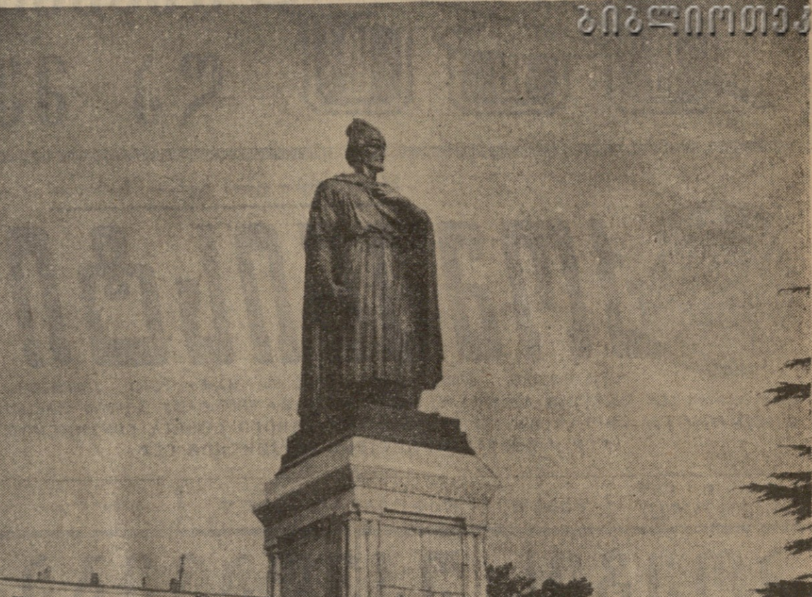
ტიბონი, 1966 წლის 30 სექტემბერს: სურათი: რესპუბლიკის მშრომელთა წარმომადგენლები, საბჭოთა უცხოეთის სტუმრებთან შოთა რუსთაველის ძეგლის...