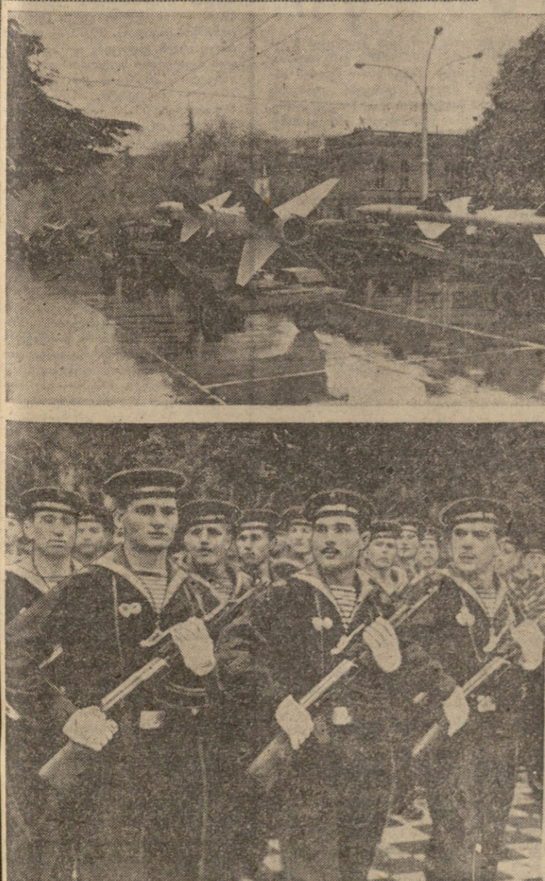
ოქტომბრის 49-ე წლისთავის დღესასწაულზე ჩვენს რესპუბლიკაში. სურათი: ჯამოთი — რატიონალური ტექნიკის შევსებით მუშაობის ხარისხის ამაღლება; მარჯვნივ — სადღესასწაულო დემონსტრაციები ქალაქში სოფელში, ბათუმში და ცხინვალში.

პარიზი, 9 ნოემბერი. (საქიპი). ი. ჯაფარიძის განცხადება. საქართველოს ხალხმა დაამყარა სახელმწიფოებრივი ერთობა და აღადგინა დამოუკიდებლობა. საქართველოს ხალხმა დაამყარა სახელმწიფოებრივი ერთობა და აღადგინა დამოუკიდებლობა.