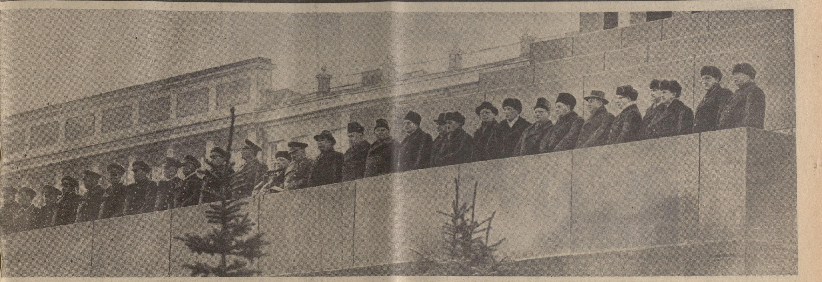
მოსკოვი, წითელი მოედანი. 1966 წ. 7 ნოემბერი. პარტიისა და მთავრობის ხელმძღვანელები ვ. ი. ლენინის მავსოვლეობის ტრიბუნაზე.

ჩვენი საყოველთაო თანისი პრესაგონს ორგანიზაციით ნელს იწყებს იხე კლირი და გვიცხე, როგორც პრესაგონს პრესაგონს