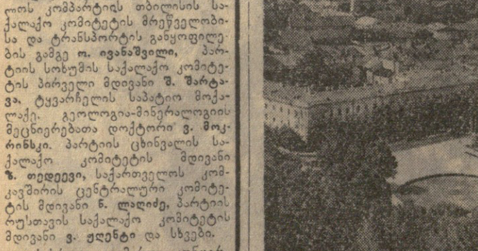
ბილენისი, ხელ გელმანისის კოშკიდან.