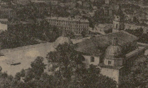
ბილენისი, ხელ გელმანისის კოშკიდან.