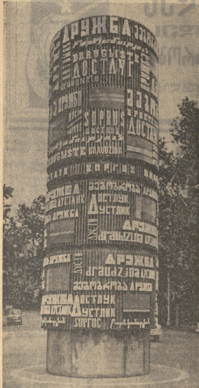
სურათი: მეგობრობის კოლონად რუსთაველის მოედანზე თბილისში.