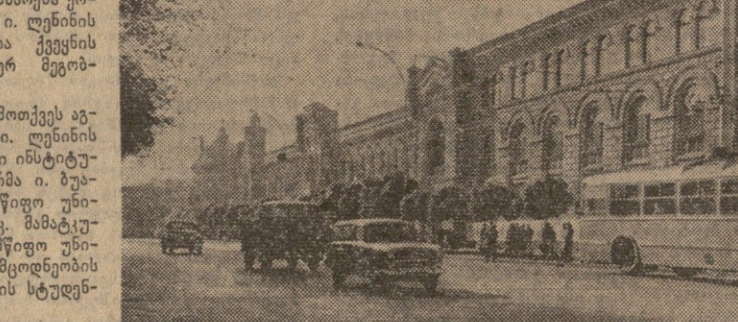
ბაქო. საბარის სახელობის სკვერი ნიჟამის მოედანზე.