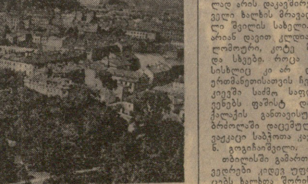
ბილენისი, ხელ გელმანისის კოშკიდან.