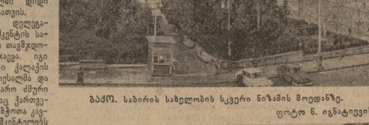
ბაქო. საბარის სახელობის სკვერი ნიჟამის მოედანზე.