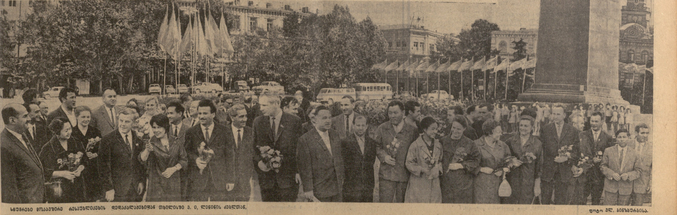
საბჭოთა კავშირის 47-ე წლის დღესასწაულის აღინიშნებასთან დაკავშირებით თბილისში 30 მაისს, ლენინის ძეგლისთან, გაიმართა მემკვიდრეობის ღვაწის დღესასწაული.

საქართველოს კომუნისტური პარტიის თბილისის კომიტეტი და საქართველოს სსრ საზოგადოება „ცოდნის“ თბილისის სატელევიზიო ორგანიზაცია აწვევენ დიდი ტელეფონის სოციალისტური რევოლუციის 50 წლისთავისადმი მიძღვნილ „საოქტომბრო კითხვას“