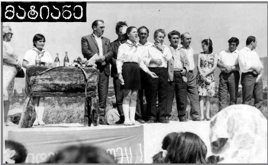
მდინარე მტკვარზე ხიდის გახსნის ცერემონიალი. 1970 წელი