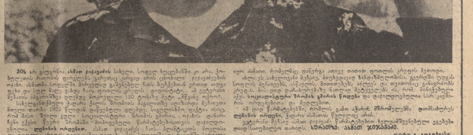
30 წ. არ გაუვლია ასეთი წარმატების სახელი, სოფელ ზეგუნდში კი არა, ქვეყნის რაიონის ფარგლებს გარეთაც კარგად ირის ცნობილი კრეატივების ოჯახი. ასეთმა სოფელმა პირველად გახსნა ზეგუნდის პირველი საბჭო. ასეთმა სოფელმა პირველად გახსნა ზეგუნდის პირველი საბჭო. ასეთმა სოფელმა პირველად გახსნა ზეგუნდის პირველი საბჭო.