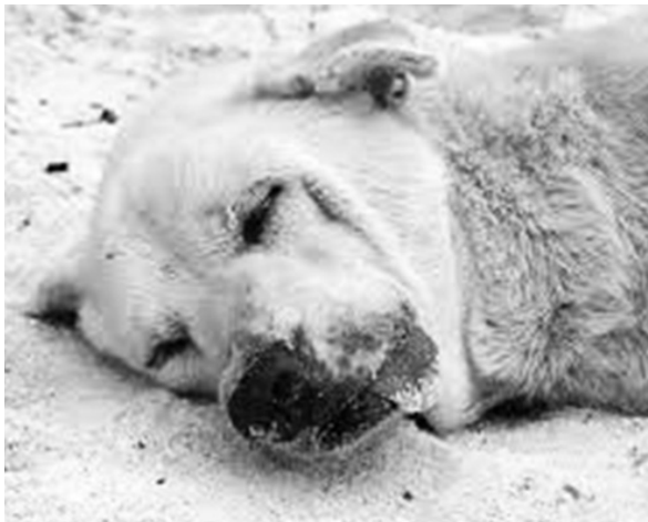
- აუცილებელია, რეგიონში ცხოველებისადმი სასტიკი მოპყრობის თავშესაფარი აშენდეს, სადაც დაზიანებული ძაღლების გადაყვანა იქნება შესაძლებელი. ახლა ცხოველების

29 იანვარს პროკურატურამ ცხოველისადმი სასტიკი მოპყრობის ფაქტზე ერთ პირს ბრალდება წარუდგინა. შინაგან საქმეთა სამინისტროს მიერ გავრცელებულ ინფორმაციაში ვკითხულობთ: „შსს-ს მიერ ჩატარებული გამოძიებით დადგინდა, რომ 22 იანვარს, ბათუმში, ბრალდებულმა პნევმატური იარაღით მიუსაფარ ძალის დაზიანებები მიყენა, რის შედეგადაც ცხოველი დაიღუპა. ბრალდებულს ბრალო საქართველოს სისხლის სამართლის კოდექსის 259-ე მუხლის პირველი ნაწილით წარედგინა, რაც სასჯელის სახედ და ზომად ერთ წლამდე თავისუფლების აღკვეთას ითვალისწინებს. პროკურატურის შუამდგომლობის საფუძველზე, სასამართლომ ბრალდებულს აღკვეთის ღონისძიების სახით, გირაო შეუფარდა.“