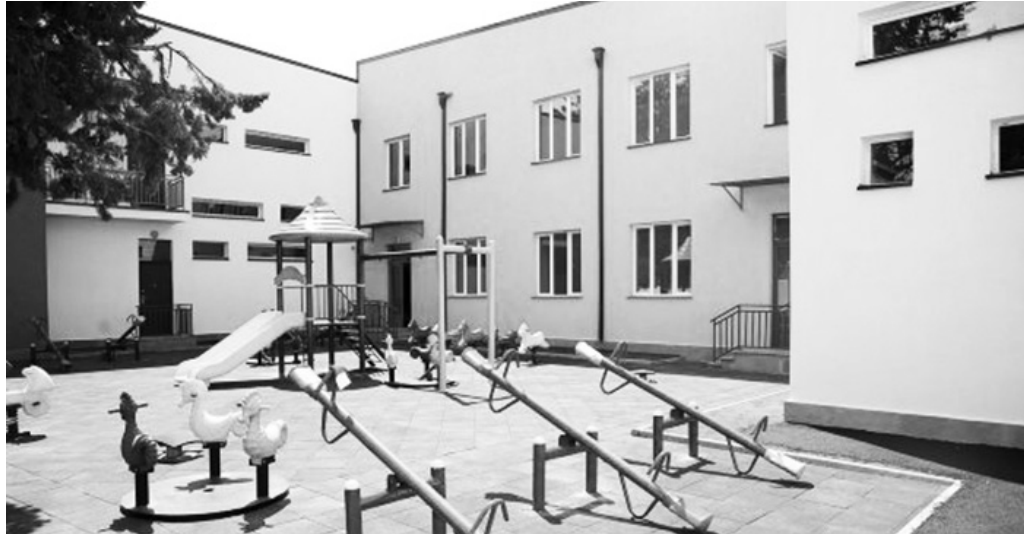
ლარი 2023 წლის ბიუჯეტში უკვე გათვალისწინებულია.

ბაღების მშენებლობა-რეაბილიტაციის პროგრამა რამდენიმე ეტაპად განხორციელდება, რისთვისაც სახელმწიფო ბიუჯეტიდან 1.3 მილიარდი ლარი დაიხარჯება. აღსანიშნავია, რომ პირველი ეტაპის სამუშაოებისთვის 100 მილიონი