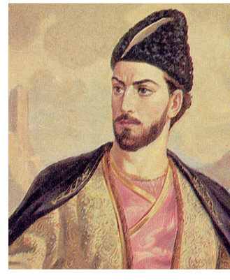
მეფე გიორგი V ბრწყინვალე

მეფე გიორგი კი გიორგი V ბრწყინვალე... პროფესორმა შ. მესხიამ დეტალურად განიხილა თავის ზემოთაღნიშნულ ნაშრომში განიხილული ყველა არგუმენტი და ხაზგასმით აღნიშნა, რომ იზიარებს ვ. ცისკარიშვილის შეხედულებას ამ საკითხზე. აკად. ბერძენიშვილი აზრით განძანის წარწერებში მოხსენიებული შალვა ან ჯაველი, ან თორელი, უფრო კი მკვლევარი უკანასკნელი თვალსაზრისისკენ იხრება, თუმცა საკითხს მაინც ღიად ტოვებს.