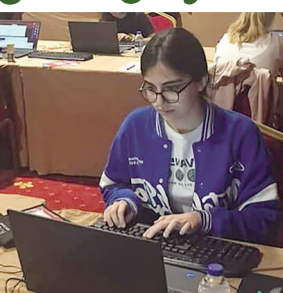
მოსწავლე მონაწილეობს ოლიმპიადის პროგრამაში

პერსონის გოგონათა ოლიმპიადი ინფორმატიკაში, თურქეთში, ქალაქ ანტალიაში გაიმართა, რომელშიც საქართველოს მოსწავლე გოგონათა ნაკრებიც იღებდა მონაწილეობას. ოლიმპიადი სულ 45-მდე ქვეყნის წარმომადგენელი მონაწილეობდა. ამ ფართომასშტაბიან მაღალრეიტინგულ შეჯიბრში 2022 წელს, საქართველოს ინფორმატიკის ნაკრებმა გუნდებმა მსოფლიო, ევროპის ახალგაზრდულ და ევროპის გოგონათა ოლიმპიადებზე სულ 1 ოქროს, 2 ვერცხლის, 5 ბრინჯაოს მედალი და 3 საპატიო დიპლომი დაიმსახურეს.