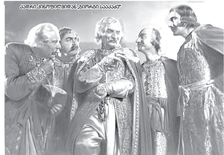
კახერი ბრძოლიდან „გიორგი სააკაძე“

1625 წლის 7 აპრილს, ხარება დღეს, ქართველთა გამარჯვება, ყიზილბაშთა რჩეულ ჯარზე, ერთადერთ, დიდგორის გამარჯვებას შეიძლება შევადაროთ. 1629 წლის 3 ოქტომბერს, თურქეთში, დიდი მოურავის სიკვდილით დასჯის ნამდვილი მიზეზი საშობლოში გამოპარვის მცდელობა იყო და ალთუნ კალაში („ოქროს ციხეში“) მის მიერ გამოგზავნილი იარაღი და ძვირფასეულობა, რომლითაც საქართველოს გაერთიანებისათვის ახლა აჯან-