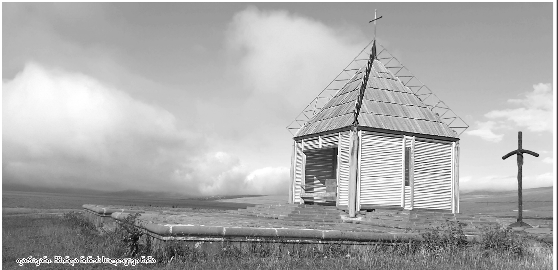
ფარავანი, წმინდა ნინოს სალოცავი ნიშა