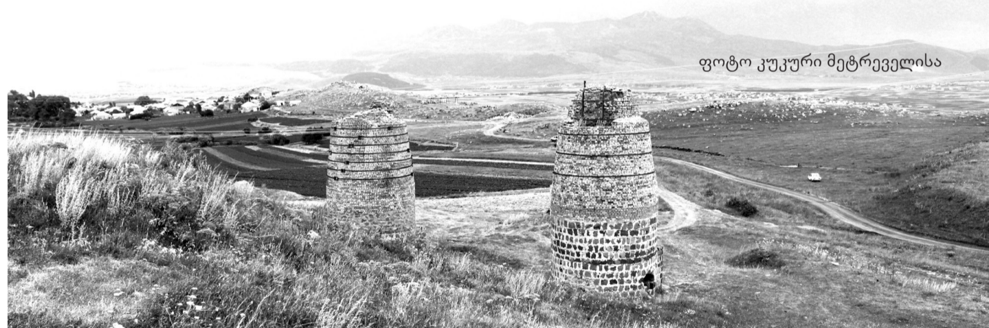
ფოტო კუკური მეტრეველისა

გალრიანს ის უხარიათ, ის ემღერებათ, ქვეყნის მშვენებად ძმობის დარია, ფრთამედგარია ხალხის ხმა, ნება. იმღერე გულო, უფრო გულიან, სიხარულია ბაღში, ყანაში, ცხელი მზის რაში დარახტულია, გაზაფხულია ჩემს ქვეყანაში! თუ გული მიძგერს მე სასიმღეროდ, ეს ხომ მადლია მშობელი მიწის, სადაც ფესვები მიდგია, ვხარობ, რაზეც თაკარა მზის სხივით ვინვი. თუ სიტყვა მერჩის აზრის ნათებად და თუ ჩიფჩიფით ვაგონებ ვისმე,