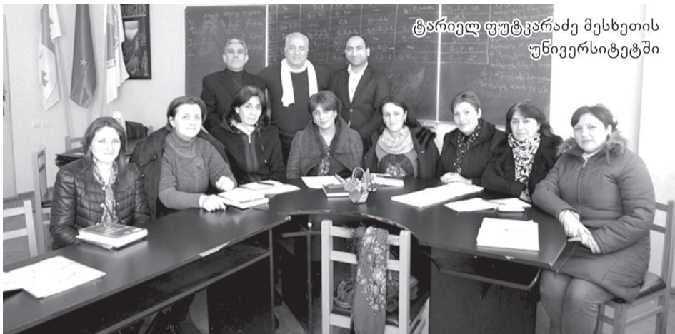
ტარიელ ფუტყარაძე მესხეთის უნივერსიტეტში

დღეს, საქართველოში, იშვიათია ადამიანი, რომელიც არ იცნობდეს ტარიელ ფუტყარაძეს, როგორც გამოჩენილ ქართველ მეცნიერს, მკვლევარს, საზოგადო მოღვაწეს, უპირველესად კი, დიდ პატრიოტს. იგი, სხვებისაგან განსხვავებით, იმითაც გამოირჩევა, რომ არასოდეს არ აკეთებს პოპულისტურ განცხადებებს, მისი ცხოვრების კრედიტს მხოლოდ საქართველოს უკეთესი მერმისისათვის დაუღალავი ბრძოლა.