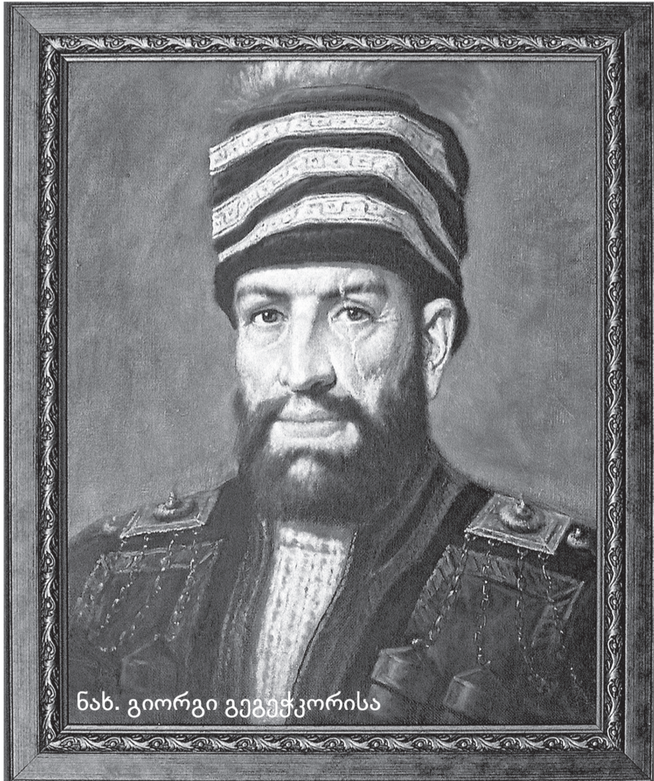
ნახ. გიორგი გეგელკორისა

ერეკლე მეფის მიერ შეთავაზებული სამხედრო მოქმედებების გეგმა 1769 წლის შემოდგომაზე ტოტლებენს მიუღია და რუს-ქართველთა ჯარს ამ გეგმით უნდა დაეწყოს მოქმედება. სურდა თუ არა ტოტლებენს, იგი მაინც უნდა დაძრულიყო ერეკლესთან ერთად ახალციხისაკენ, რადგან მისი ადრინდელი განცხადებები ახალციხეზე ლაშქრობებში მონაწილეობაზე აშკარა უარის თქმის უფლებას არ აძლევდა. 1770 წლის 14 აპრილს ერეკლე მეფე და ტოტლებენი რუს-ქართველთა ჯარით სადგერში იდგნენ. ტოტლებენს მეფისთვის წინადადება მიუცია, ქართული ჯარის ნაწილი სადგერის ციხეში დაეტოვებინა, თვითონაც სურვილი გამოუთქვამს 1 ზარბაზნისა და 60 ჯარისკაცის დატოვებაზე, მაგრამ ერეკლე მეფე ამის წინააღმდეგ წასულა. „სადგერის ციხეში ჯარი მთხოვა დასაგდებლად, – წერდა ერეკლე რატიევს, – თავისი ჯარისაც მითხრა, 60 კაცს და ერთ ზარბაზნს დავაგდებო.“