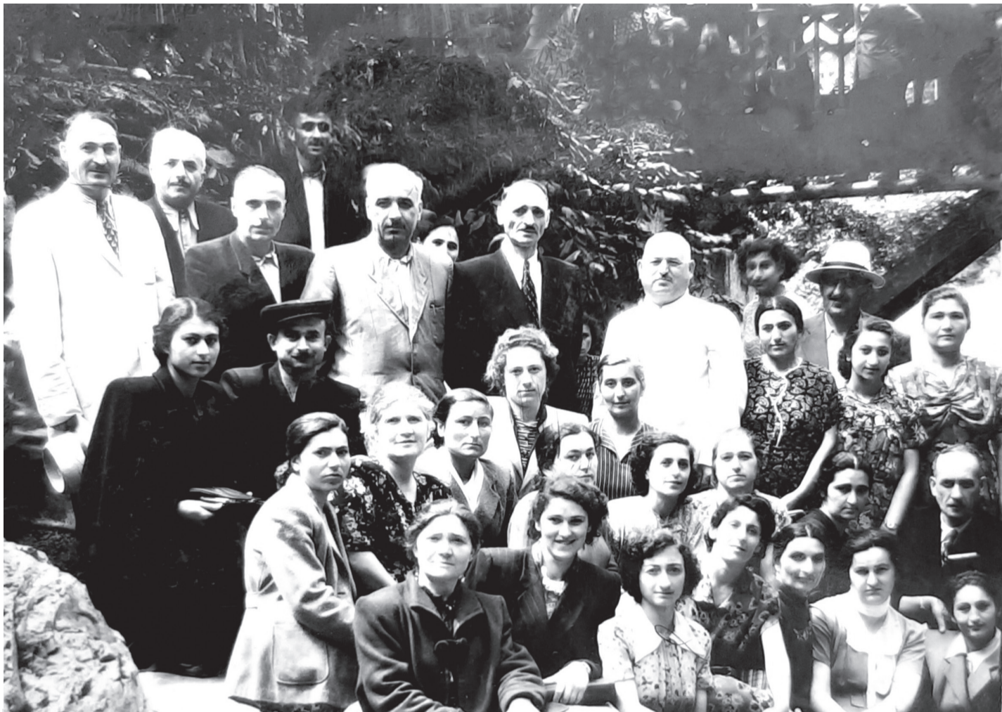
რესპუბლიკის პედაგოგთა ერთი ჯგუფი ქ. ბორჯომში. 1955 წელი. დ.ასპინძა