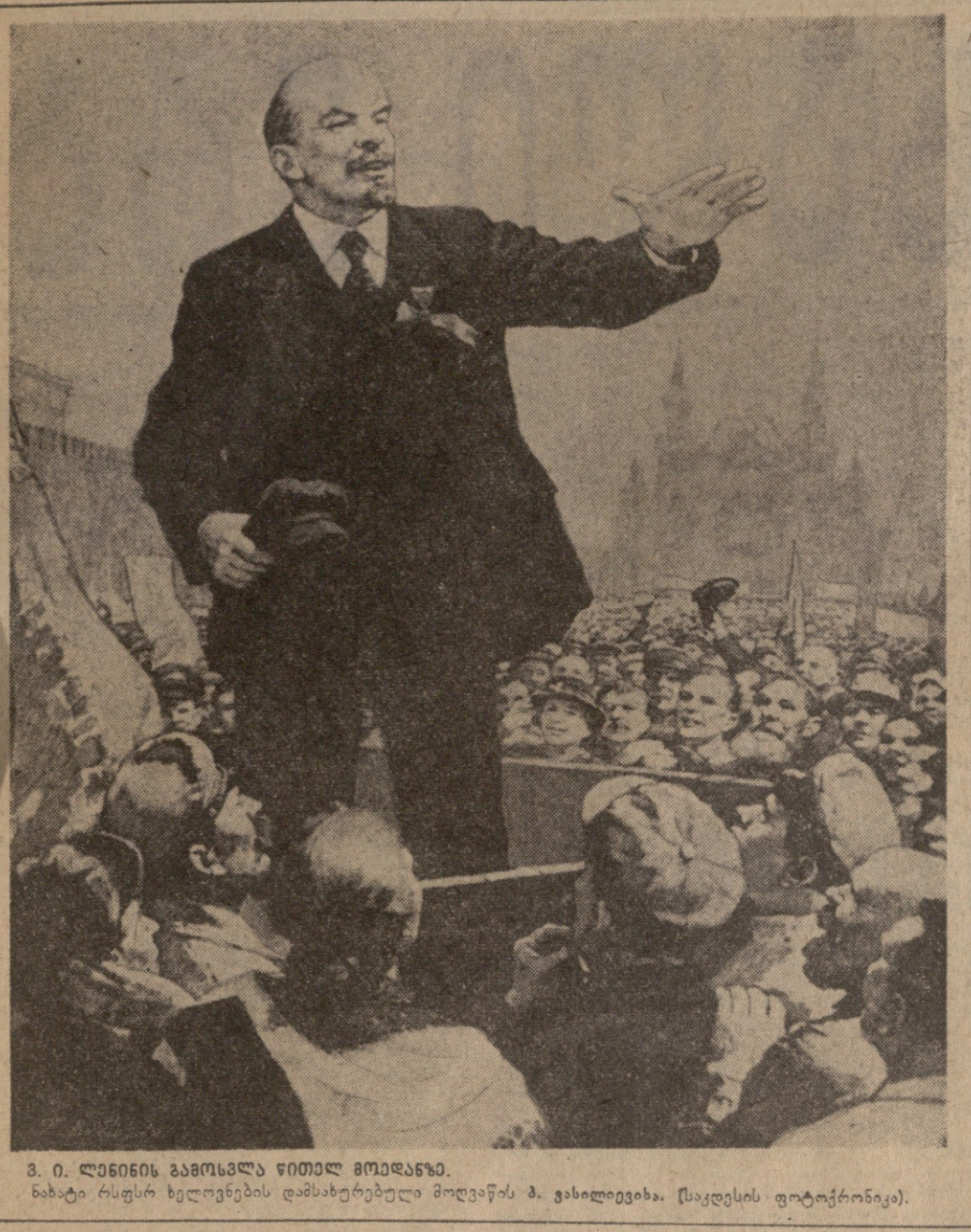
ბ. ი. ლენინის გამოსვლა წითელ მოედანზე...