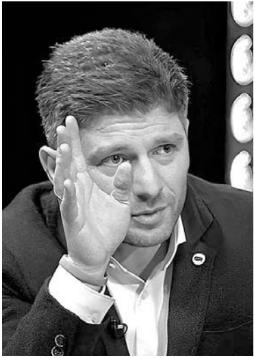
გვესაუბრება ღარი ცაგურია:

— დანი, რა პოლიტიკურ წარმოდგენებს მართავს „ნაციონალური მოძრაობა“ და როგორია მისი თეატრალური დასი?