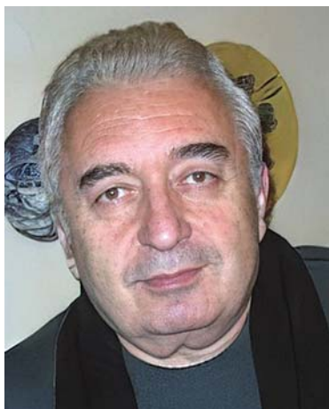
„საერთო გაზეთი“ აგრძელებს საუბარს აკადემიკოს რაშაშ ბახრაძის შესახებ: