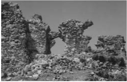
„არს მთის კალთას, სკანდას, სასახლე მფეფთა და ციხე დიდი, დიდშენი“ მასშობი პაპრატიონი