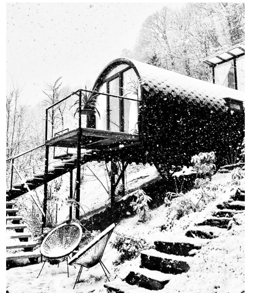
იტაციურ ელფერს სძენს, რაც დამსვენებლებს ბუნებისა და ადამიანის განუყოფლობაზე, მათ ერთიან საერთო რაობაზე აფიქრებს. ამ პროექტის საბოლოო მიზანია სწორედ ეს არის.

რთულე საქმის თანმდევი და ხშირად ერთგვარ საინტერესო გამოწვევადაც იქცევა. ვიცი და მჯერა, შრომითა და მოთმინებით ყველაფრის მიღწევა შესაძლებელია. რაც შეეხება „გუდმაიდს“, ვცდილობ, თითოეულ სტუმარს შთაბეჭდილებებით სავსე წუთები ვაჩუქო და ჩემი პატარა წამოწყება, გარდა სტუმარმასპინძლობისა, იყოს არაერთგვაროვანი, დამსვენებელი გაეცნოს მთიანი აჭარის ეთნოგრაფიას, სამზარეულოს, სხვადასხვა კულტურულ თავისებურებებს. გარდა ეთნოგრაფიული ელემენტებისა, სიმწვანეში ჩამალული ხის პატარა კოტეჯები ადამიანებს ავიწყებს ურბანულ ყოფას და ხმაურს, მაჭახლის ხეობაში მოგზაურობას კი ერთგვარ მედ-