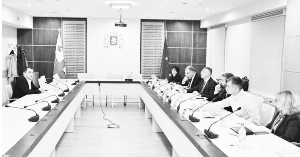
საქართველოს პრემიერ-მინისტრი მისთვის საკონკურსო კომისიის მიერ ანტიკორუფციული ბიუროს უფროსობის კანდიდატების წარდგენიდან 1 კვირის ვადაში ამ კანდიდატთან ერთ-ერთს ნიშნავს ანტიკორუფციული ბიუროს უფროსის თანამდებობაზე ან მოტივირებულ უარს აცხადებს ანტიკორუფ-