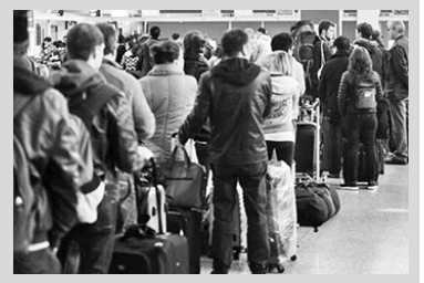
ლდოვა -1. ცნობისთვის: საქართველოს რეაქციის შეთანხმებები გავორმებული აქვს ევროკავშირთან, დანიასთან, ნორვეგიასთან, მოლდოვასთან და ა.შ.

შინაგან საქმეთა სამინისტრომ რეაქციის ფარგლებში უნებართვოდ მცხოვრები საქართველოს მოქალაქეების უკან დაბრუნების 2022 წლის სტატისტიკა გამოაქვეყნა. როგორც ოფიციალური მონაცემებიდან ირკვევა, საანგარიშო პერიოდში სულ საქართველოს 3 034 მოქალაქის რეაქციის განხორციელება შედარებისთვის: 2021 წელს ეს მაჩვენებელი 2 547 იყო. კერძოდ: გასული წლის განმავლობაში საქართველომ სულ 3 034 რეაქციის განაცხადი მიიღო, რომელთაგან 3 014 დააკმაყოფილა, ხოლო 20-ზე უარყოფითი გადაწყვეტილება მიიღო. რეაქციის ფარგლებში უნებართვოდ მცხოვრები საქართველოს ყველაზე მეტი - 1 681 მოქალაქე გერმანიიდან დაბრუნეს, საფრანგეთიდან - 560; შვეიცარიიდან - 143; საბერძნეთიდან - 120, პოლონეთიდან - 101. სხვა ქვეყნების სტატისტიკა ასეთია: ბელგია - 71; იტალია - 66; შოლანდია - 57; ესპანეთი - 51; შვედეთი - 42; დანია - 41; ავსტრია - 39; პორტუგალია - 18; ჩეხეთი - 12; კვიპროსი, ლუქსემბურგი - 9; ბულგარეთი, ფინეთი, ნორვეგია - 3; ირლანდია, უნგრეთი - 2; მი-