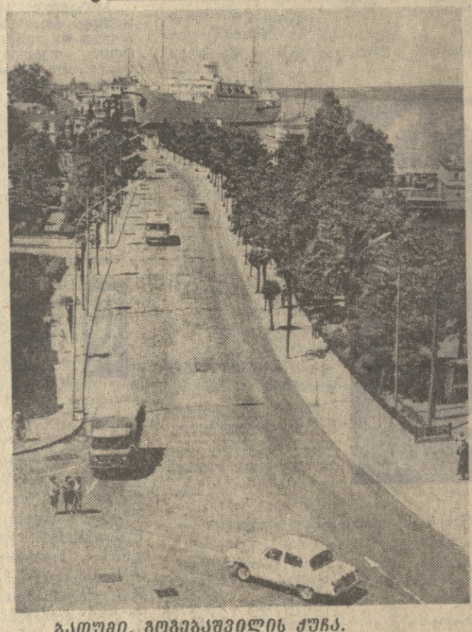
ბათუმი. გომეგავილის ქუჩა.

პირი წელი შეუსრულდა გერნალ „ლიტერატურული გზარას“. გერნალმა ითავიდან იხრებოდა უფრო მარტოა მუშაობა და გამართულა თავისი პირველი მისწრაფება — გულწრფელად ესაუბრა ჩვენს დიდ თანამოემართლებს.