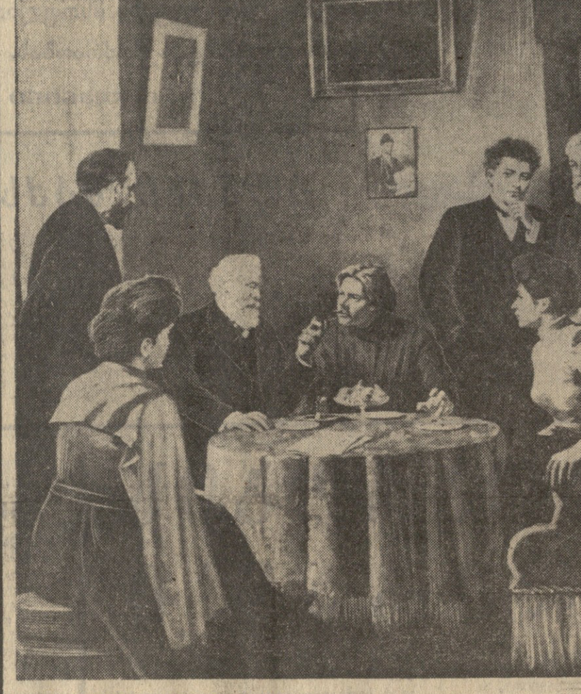
„მასის გორაკი მუშათაში, 1903 წელი“