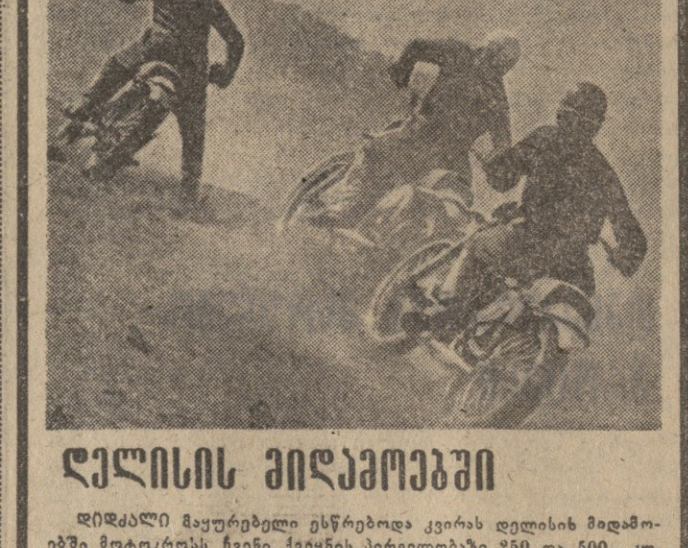
პარტიკომის 8 აპრილი... პარტიკომის 8 აპრილი...