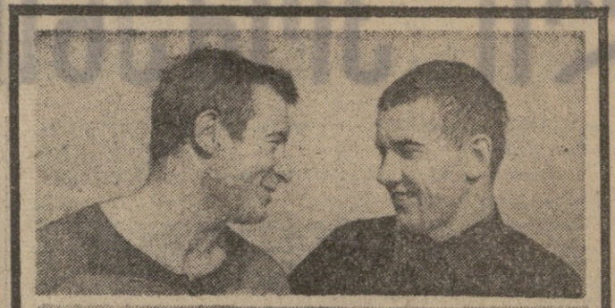
პარტიკომის 8 აპრილი... პარტიკომის 8 აპრილი...