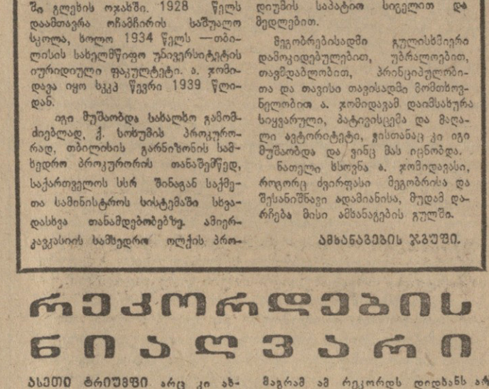
პარტიკომის 8 აპრილი... პარტიკომის 8 აპრილი...