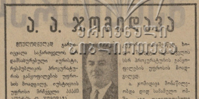
პარტიკომის 8 აპრილი... პარტიკომის 8 აპრილი...