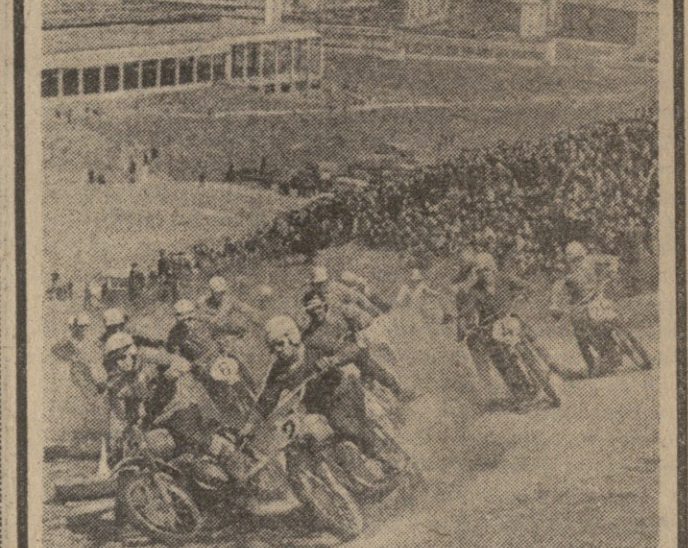
პარტიკომის 8 აპრილი... პარტიკომის 8 აპრილი...