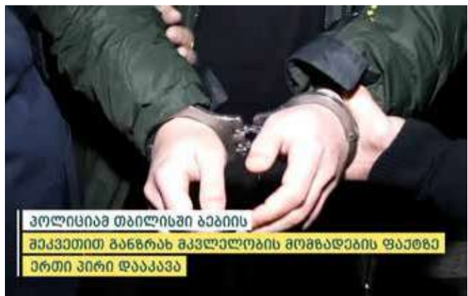
პოლიციამ თბილისში ბავიის შიკაგოში განზრახ მკვლელობის მომზადების ფაქტზე ერთი პირი დააკავა

დანაშაული 16-დან 20 წლამდე ან უვადო თავისუფლების აღკვეთას ითვალისწინებს.