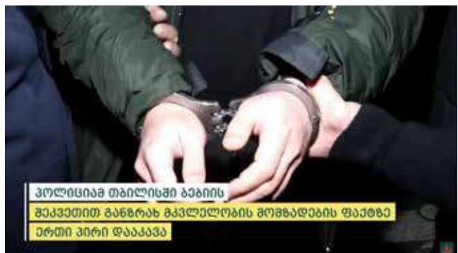
პოლიციამ თბილისში ბავიის შიკაგოში განზრახ მკვლელობის მომზადების ფაქტზე ერთი პირი დააკავა

ოჯახის წევრის მიმართ ანგარებით, შეკვეთით განზრახ მკვლელობის მომზადების ფაქტზე გამოძიება მიმდინარეობს საქართველოს სისხლის სამართლის კოდექსის 18-109-ე მუხლის „კ“ და „ნ“ ქვეპუნქტებით.