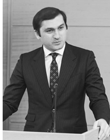
ბის, ტყის მოვლა-აღდგენას, კონსერვაციული ღონისძიებების დაწესებას, კლიმატური ცვლილებების მიმართ ტყის მდგრადობის გაძლიერებას, ტყით სარგებლობასა და საშემე-სამასალე მერქნით მოსახლეობის უზრუნველყოფას.

შნა, რომ პროგრამის დაწყება დაეხმარება აჭარის სატყეო სააგენტოს ინსტიტუციურ გაძლიერებაში, ასევე, მნიშვნელოვანი იქნება ტყის მოვლა-შენახვისა და აღდგენის მხრივ. გერმანიის ფედერაციული რესპუბლიკის მთავრობასთან, ასევე, განვითარებისა და რეკონსტრუქციის ბანკთან ერთად მნიშვნელოვანი პროექტის განხორციელებას ვიწყებთ, რომლის ფარგლებშიც მოხდება როგორც აჭარის სატყეო სააგენტოს ინსტიტუციური გაძლიერება, ასევე, ტყის რესურსების, მთლიანად სატყეო ფონდის აღდგენა-კონსერვაცია, - აღნიშნა მან. პროექტი ხელს შეუწყობს აჭარის სატყეო სააგენტოს ტყის მართვის სრულყოფილ ორგანოდ გარდაქმნას, რომელიც განახორციელებს ტყის მდგრადი მართვის სრულ ციკლს, მათ შო-