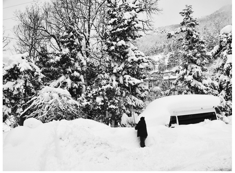
ბის დეპარტამენტის 16 და ქედის მუნიციპალიტეტის 2 ერთეული ტექნიკა მუშაობს გზების გაწმენდაზე. მუნიციპალიტეტის სოფლებში დენის მიწოდებაში მცირეოდენი შეფერხებები იყო, რაც სამუშაო რეჟიმში გამოსწო-

დროებით შეიზღუდა ქედა-წონიარისის გზის ორ მონაკვეთზე ზვავების ჩამოწოვის გამო. ზვავები ჩამოდის ქედა-მერისის, დანდალი-ხარაულის, უჩხითი-მერისის, ზვარე-ნესოვლის გზებზე. აჭარის საავტომობილო გზე-