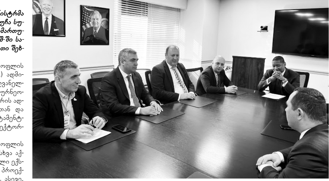
სტენციაში ჩართული სხვადასხვა ინსტიტუციის ხელმძღვანელებთან, მათ შორის, ტენასის შტატის ექსპერტის ცენტრის ბიუსტონის წარმომადგენლობასთან, Prairie View A&M უნივერსიტეტის ადმინისტრაციასთან და აკადემიურ პერსონალთან, ოჰაიოს შტატის ექსპერტის ოფისში, Central State უნივერსიტეტის პრეზიდენტთან, ასევე, ტენასის და ოჰაიოს შტატის იმ სკოლებთან, რომლებიც ექსპერტებში არიან ჩართულები. პროექტი მიმდინარეობს სოფლის მეურნეობის ექსპერტის პროექტის ფარგლებში, რომელსაც ახორციელებს „ამომავლის ფერმერი“ აშშ-ის სოფლის მეურნეობის დეპარტამენტი.

ვიზიტის ფარგლებში შეხვედრები 10 დღის განმავლობაში აშშ-ის სხვადასხვა შტატში მიმდინარეობდა, შეხვედრები გაიმართა ტენასის და ოჰაიოს შტატებში აგრარულ ექ-