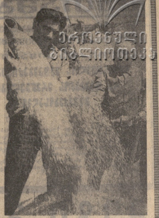
ბარდუნი მისი ბარათი