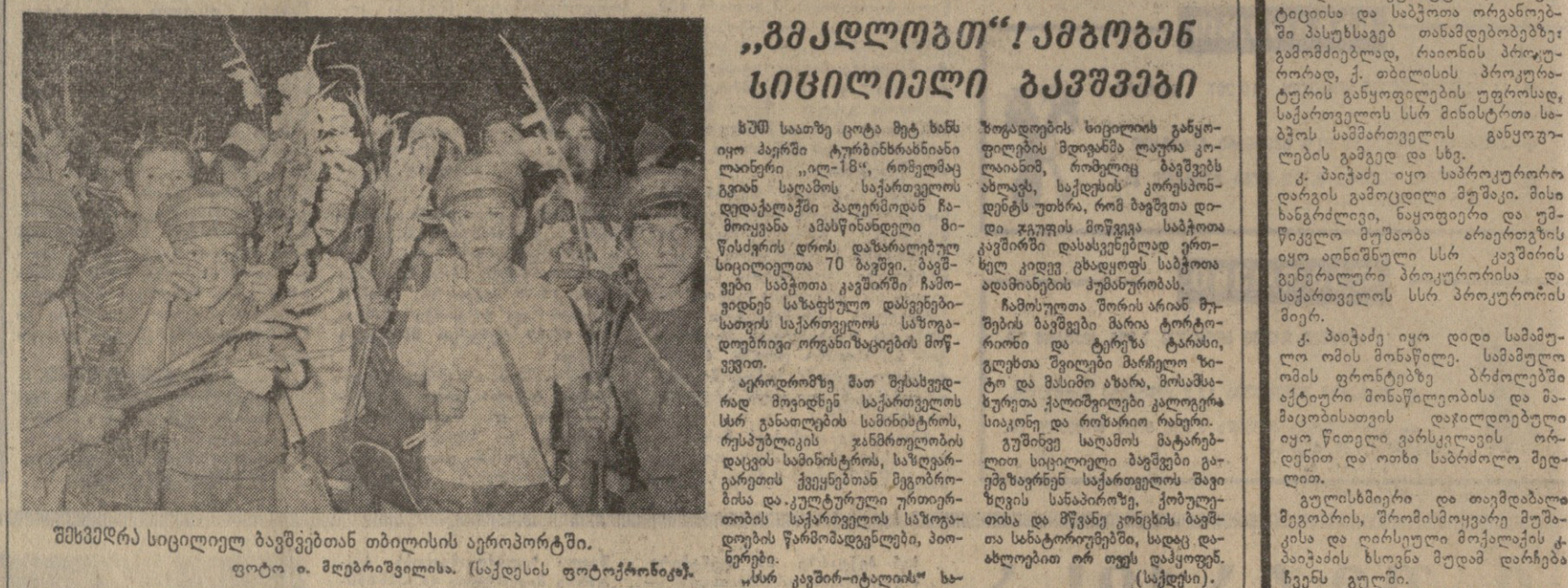
მხმარებელი სიცილიელ ბავშვებთან თბილისის აეროპორტში.