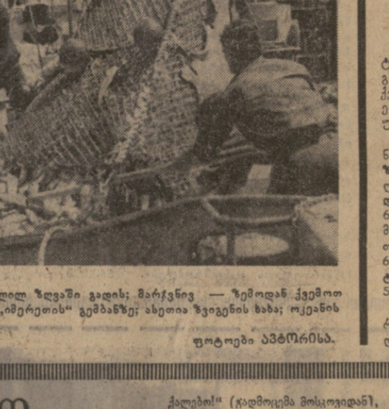
სპორტის მწიფების... სპორტის მწიფების... სპორტის მწიფების...