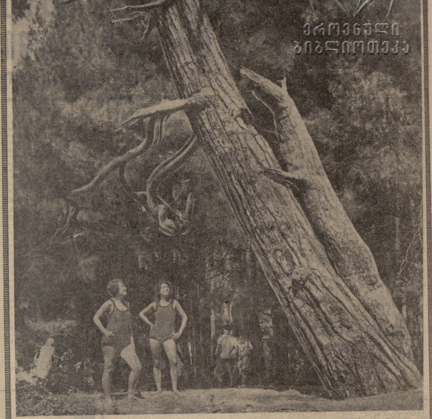
ბიძინა ახალციხეში მრავალსაუკუნოვანი ფიგურა დას. და ყველა ვინც აქ იყავი, ტკბება ჩვენი ქვეყნის ამ დამაბრუნებელი ხელოვნებით.