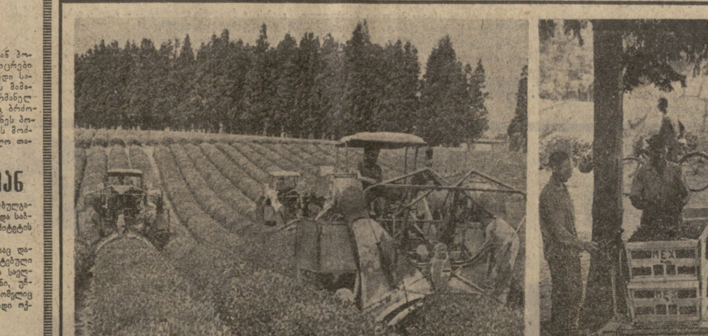
მს ნამდვილი ბრძოლის გელი იყო, სადაც ჩაის ფოთლზე გამარჯვება იქედებოდა. მარცხნივ სურათზე ატეხულია ორსამურის ჩაის საბჭოთა მეურნეობის, ხოლო მარჯვნივ — ლაითურის ჩაის საბჭოთა მეურნეობის ტექნიკურის პლანტაციებში მუშაობის სურათი.

პარტიული ჩაის მოყვანის ოსტატებმა შესანიშნავი წარმატებით გაევახარეს. სასიამოვნოა, რომ ამ გამარჯვებაში მათ ხელს უწყობდა მეცნიერებთა მონაპოვრები: ანტონაე სპარტოელის მეცნიერთა საბჭოთა შეესსლუბში ყველა, ვინც თავდადებით მუშაობდა მენაე პლანტაციებში.