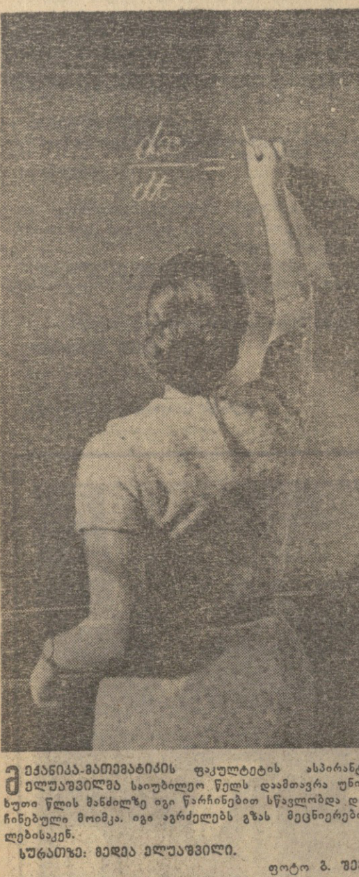
მედიანა-ბათუმის ფაქტობრივი ასპირანტი მადამ ილუზიონი...