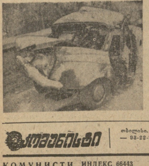
კომუნისტი ინდექსი 66443

დროობა-სიტყვების უსაქ... (Text discussing the relationship between time and language.)