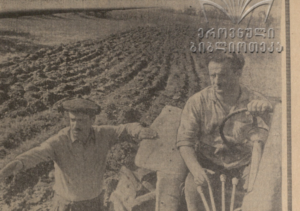
პროლეტარებო ყველა ჩვენი, შერიტლი!

ბანიჩასკის რაიონის მშრომელთა დელეგაციის წევრებმა საქართველოს კომუნისტური პარტიის ცენტრალური კომიტეტის წინაშე წარმოადგინეს რეზოლუცია, რომელიც მიმართულია მთელი საქართველოს მშრომლებისადმი.