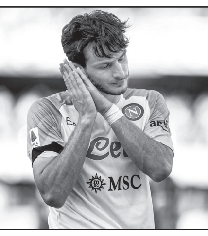
ქალიან მნიშვნელოვანი როლი ითამაშა ჩემს ადაპტაციაში, გუნდში ძალიან კარგად მიმიღეს და არ ველოდი, ამისთვის ძალიან მადლობელი ვარ.

– კონკრეტულად ერთს ვერ გამოვარჩევ, ყველანი კარგი ბიჭები არიან, ყველასთან კარგი ურთიერთობა მაქვს, ასევე ყველა ფეხბურთელს ერთმანეთთან კარგი ურთიერთობა აქვს, თითქოს დიდი ოჯახი ვართ. ყველამ