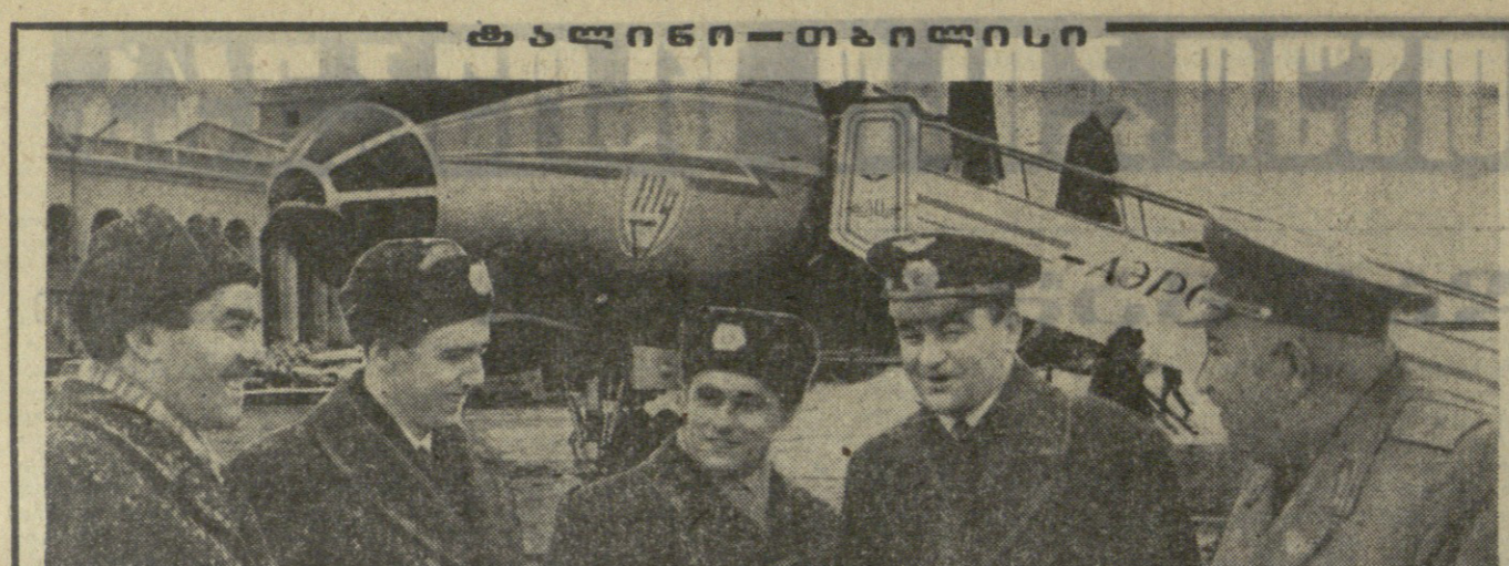
მთავრობის წევრები და მსხვერპლნი რესპუბლიკის დედაქალაქში...