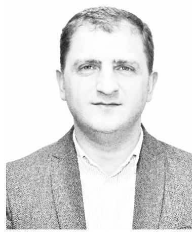
თაშორისო დონორი ორგანიზაციების მხარდაჭერით - „უცხოური ფულით“ განხორციელდა, - წერს ილია ბუჩინაძე.

პარატები და საბავშვო მხატვრული ლიტერატურა. ეს არის რამდენიმე ამონარიდი „მწვანე სექტორის“ ბოლო სამი წლის საქმიანობიდან, რომელიც სწორედ საერ-