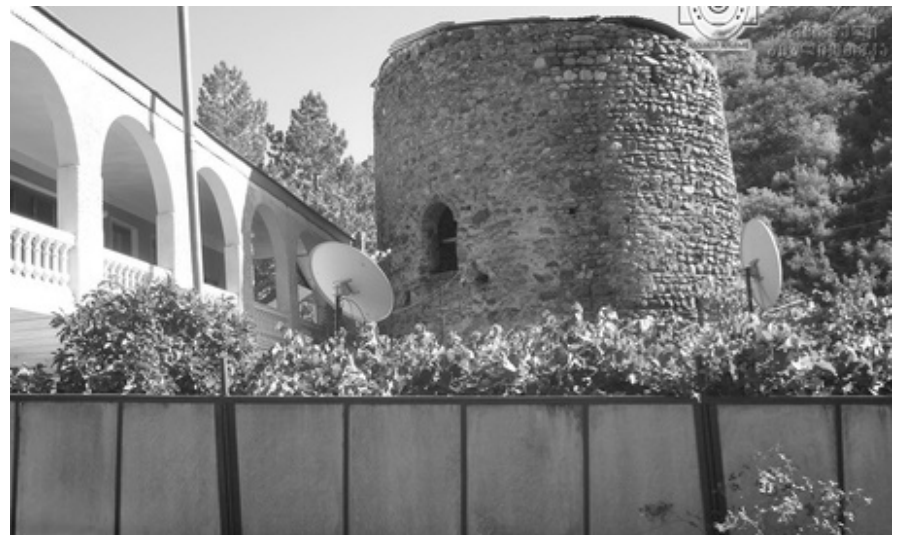
სურათზე: ფიცხელაურების ციხე-კოშკი

ექვთიმემ ასევე იკოთში მიაკვლია ქსნის საერისთავოს სტატისტიკურ აღწერილობას, სხვა 35 სიგელ გუჯართან ერთად, რომლებიც „საქართ- ველოს საისტორიო და საეთნოგრაფიო საზოგადოების“ მუზეუმს დიდ- სულონად გადასცა ვახტანგ ივანეს-ძე ფიცხელაურის დედამ... ესეც საკმარისია იმის საილუსტრაციოდ, თუ რა საგანძური ინახებოდა ქსნის ხეობის ამ უმშვენიერეს სოფელში... ამ საგანძურის შესახებ მოგვითხ- რობს ცნობილი საზოგადო მოღვაწე, სასულიერო პირი, ქართველთა შორის წერა-კითხვის გამავრცელებელი საზოგადოების წევრი ილარიონ ჯაში: „ბევრი გუჯრები მინახავს სოფელ იკოთში მცხოვრებელი აზნაუ- რის ივანე არჯევანის ძე ფიცხელაურის სახლში... ამათ გუჯრებში ხშირ- ად ნახავდით გიორგი XIII-ის მოწერილს ხელს და ბეჭედს. ეჭვი არ არის, რომ ამ გუჯრებში ბევრი საინტერესო რამე მოიძებნება“. ისტორიულ დო- კუმენტებთან ერთად ყურადსაღებია ის ნივთიერი კულტურა, რომელიც ახალგორის მოურავების ოჯახში ინახებოდა, მათ შორის ტყავზე დაწ- ერილი „ვეფხისტყაოსანი“ და ლურჯ ქაღალდზე ხელნაწერი გრამატიკა, რომლებიც ილარიონ ჯაშისთვის დედინაცვალს - იკოთელ ფიცხელაურის ქალს უჩუქებია. იმ დროს ჯაში თბილისის სასულიერო სასწავლებლის