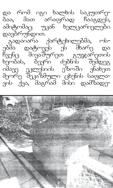
სივრცეები. დრო, როდესაც ქართველი კაცი დედასთან ერთად ხელი შეშინა ზარს სცემდა საქართველოზე გარსემორტყმულ მუსლიმანურ სახელმწიფოებს. ქვეყანა შენდებოდა და მშენებდებოდა... ვინ იცის, ამ საფლავის ქვეშ რომელიმე სახელგანთქმული თორელის ცხედარი იწვა. პიროვნება, რომელმაც თავის სიცოცხლეში მრავალჯერ ასახლა ჩვენი მხარე თორის საერისთავო. ალბათ შემთხვევითი არ უნდა იყოს, შალვა თორელის მიერ გუჯარეთის ხეობაში, კერძოდ კომოტესუბანში ლეთისმშობლის მიძინების ეკლესიის აშენება, რომელიც დღემდე, თითქმის 800 წელიწადი იწარმოებდა თავის ბრწყინვალეობას და სიდიადეს.

სავარაუდოა, აღნიშნული საფლავის ქვების მსგავსი სხეულები იყოს, მაგრამ ისინი ალბათ მინიმუმ არანა დაფარულნი და მზის სინათლეს ელიან. უნდა აღინიშნოს, რომ საფლავის ქვა ვერძის გამოსახულებით სხვადასხვა ზომისა გვხვდება, შესაძლებელია, მათ ქვეშ დიდი და ძლიერი გვარის შვილები განსვენებენ... ვინ იცის, საფლავის ქვის ქვეშ მყოფი პიროვნება სოციალური როგორი ძლიერი ვაგუფი იყო. შეიძლება იგი ომიანობის დროს თავისი სოფლის ან სულაც მთელი იმ მხარის სახელოვანი მებრძოლი ან სარდალიც კი ყოფილიყო, ვინ იცის... ძველ დროშიც ხომ მრავალჯერ ყოფილა ხალხთა დიდი მიგრაციები და პოეტისა არ იყოს: - წამკითხველო, ვინ იცის, „ბიჭო იქნებ პაპა იყო შენი“... ვუყურებ ამ საფლავის ქვას და ფიქრებში ცოცხლდება გან-