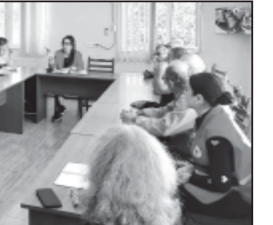
ქვეყნებისაგან განსხვავებით. მაგალითად, თუ სომხეთ-აზერბაიჯანის სახელმწიფოს შევადარებთ, რომლებიც კატეგორიულად უარს აცხადებდნენ ნეშტების იდენტიფიცირების გამოძიების საქმეში.

როგორც ნოთელი ჯვრის კომიტეტის წარმომადგენლობის მხრიდან გაუცხვრდა უგზო-უკვლოდ დაკარგულთა ძიების საკითხი, საკმაოდ დადებითი კუთხით მიმდინარეობს სხვა