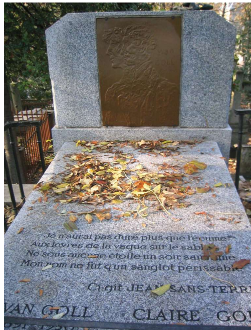
ივან გოლის და კლერ გოლის საფლავის ქვა პარიზში პერ ლაშეზის სასაფლაოზე მარკ შაგალის მიერ გაფორმებული.

ამჯერად გთავაზობთ ამ ორი გამორჩეული ექსპრესიონისტი და სიურრეალისტი მწერლისა და პოეტის სამიჯნურო პოეტურ მიმოწერას.