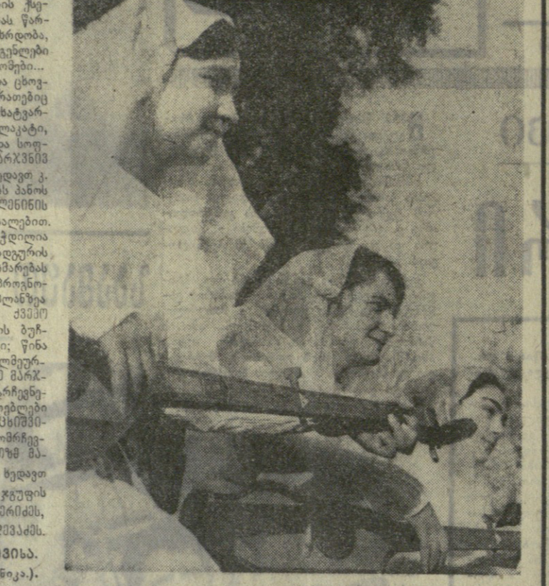
ფოტო 6. ანასტასიანის (საქდების ფოტოგრაფიკა).

კანონი პარტიის ცენტრალური კომიტეტის უკანასკნელი სესიონი, რომელიც ახალი გარემოების გათვალისწინებით შედგებოდა, სოფლის მეურნეობის მუშაკთა კომიტეტის დასაარსებლად მუშაკთა კომიტეტის დასაარსებლად მუშაკთა კომიტეტის დასაარსებლად.