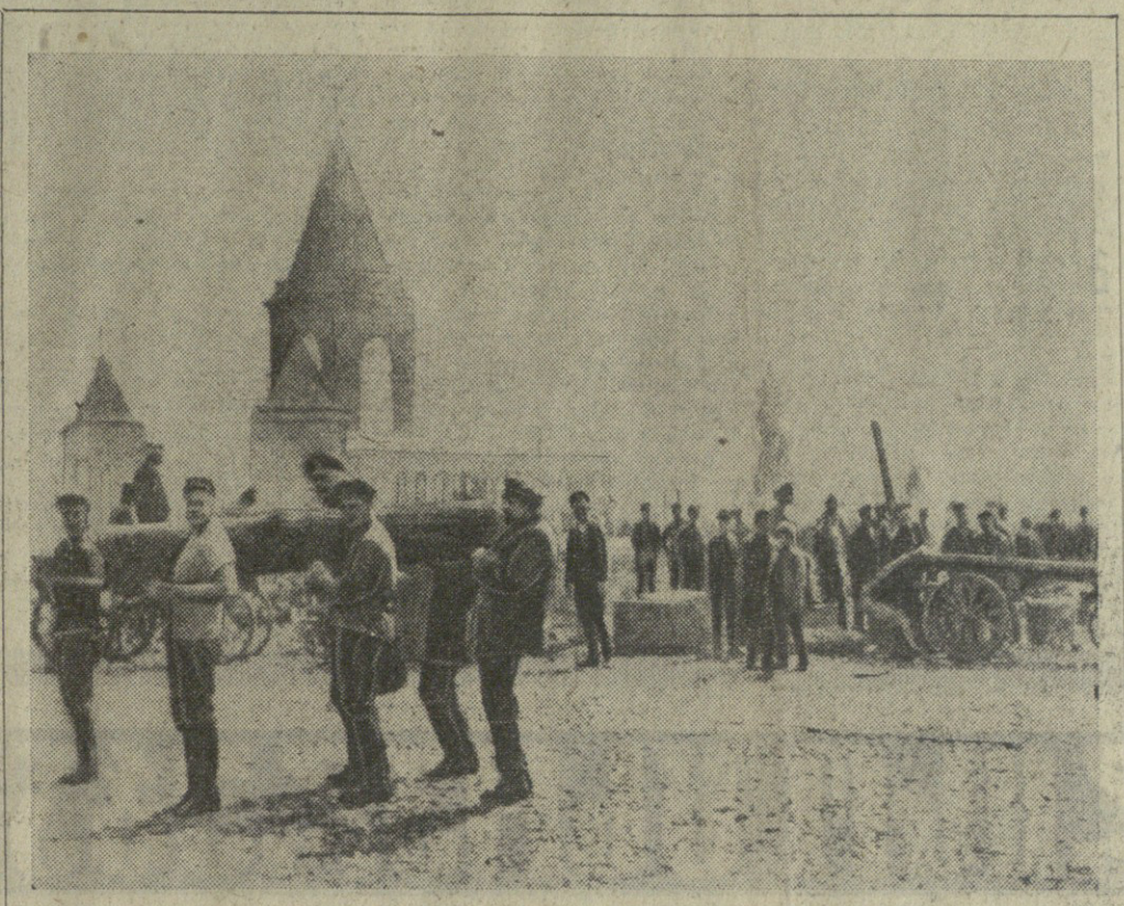
ვ. ი. ლენინი პირველ სრულიად რუსეთის შაბათობაზე კრებულ 1920 წლის 1 მაისს. (სურათი მარტოხელ-ლენინის ფოტოგრაფიის არქივიდან)

დაბრუნების მესიერებაში წარუშლელი და მტკიცე შიშვენიერება ეს სურათი — ვ. ი. ლენინის პირველი სრულიად რუსეთის შაბათობაზე კრებულ 1920 წლის 1 მაისის ფოტოგრაფია. მასობრივი იყო დაბრუნება მუშაკებისა და კულტურული და ეკონომიკური აღორძინებისათვის, მასობრივად სოციალისტური შეინერება დასრულდა.