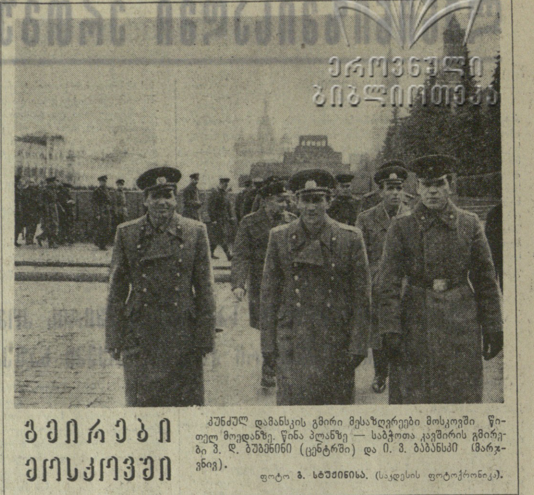
საბჭოთა დასავლეთი აკადემიის მიერ...