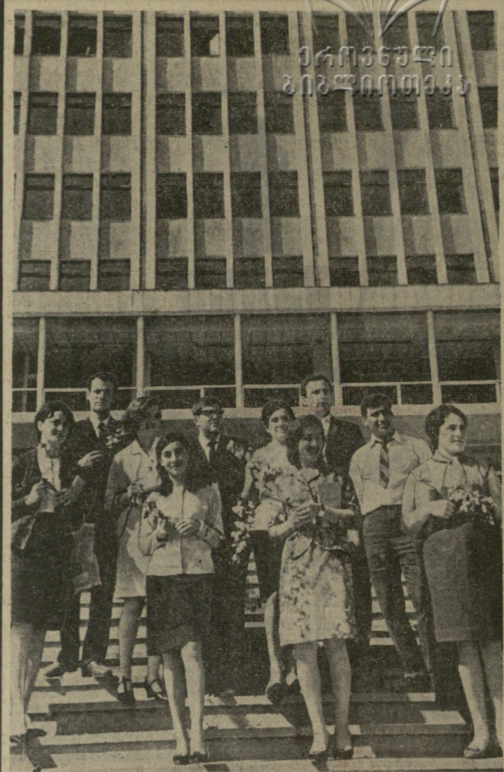
ჩვენნი ბავნიერი თოვა ჩვენნი ბავნიერი თოვა ჩვენნი ბავნიერი თოვა

სიკვლე ბათუმის ნავსადგომი სიკვლე ბათუმის ნავსადგომი სიკვლე ბათუმის ნავსადგომი