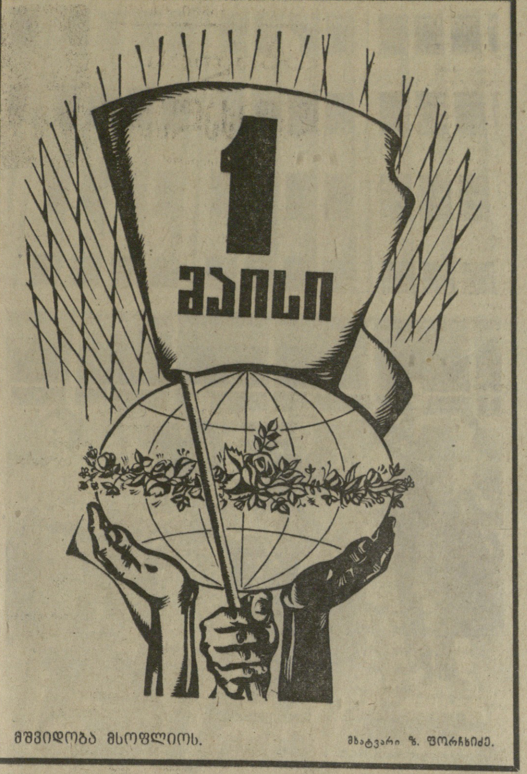
მედიდობა მსოფლიოს. მხატვარი ზ. ფორსხიძე.

რადიოსი... ახლა და 50 წლის წინათ. რადიოსი... ახლა და 50 წლის წინათ.