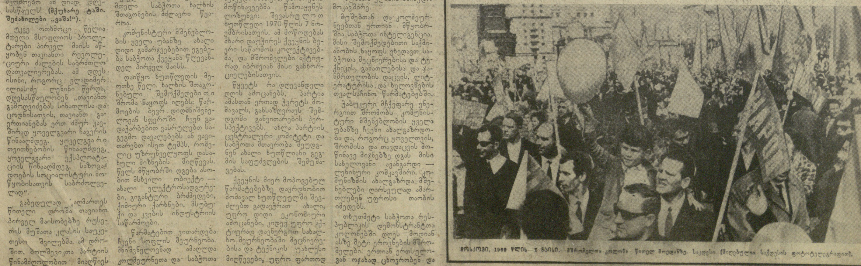
მოსკოვი, 1969 წლის 1 მაისი. მშრომელთა კოლონი წითელ მოედანზე. საქდესი. (მეღებულა საქდესის ფოტოტელეგრაფით).

ნებელ მავალითს წარმოადგენენ ხალხებისათვის, რომლებშიც კაპიტალის ბატონობისაგან განთავისუფლებისათვის იბრძვიან.