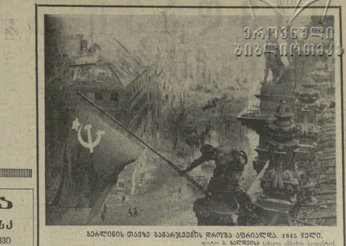
ბარკინის თავაზი გამარჯვების დროს ავრიალდა. 1945 წელი.

მეგ ბარბაკეძის დადგინებული... ურდვალი თანაგებობის დადგენა.