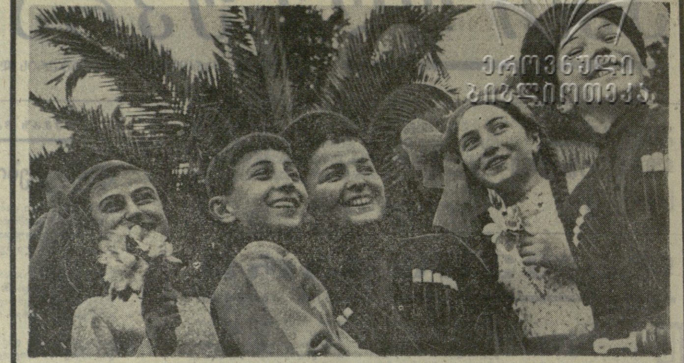
ბათუმის გ. ო. ლენინის სახელობის პირველი პარტიის სიბერისა და ცხვირის ანამბოლი „გაზ-ფული“ კარგად არის ცნობილი ჩვენს რესპუბლიკაში. ეს ახალგაზრდული კოლექტივი წარმოადგენს...