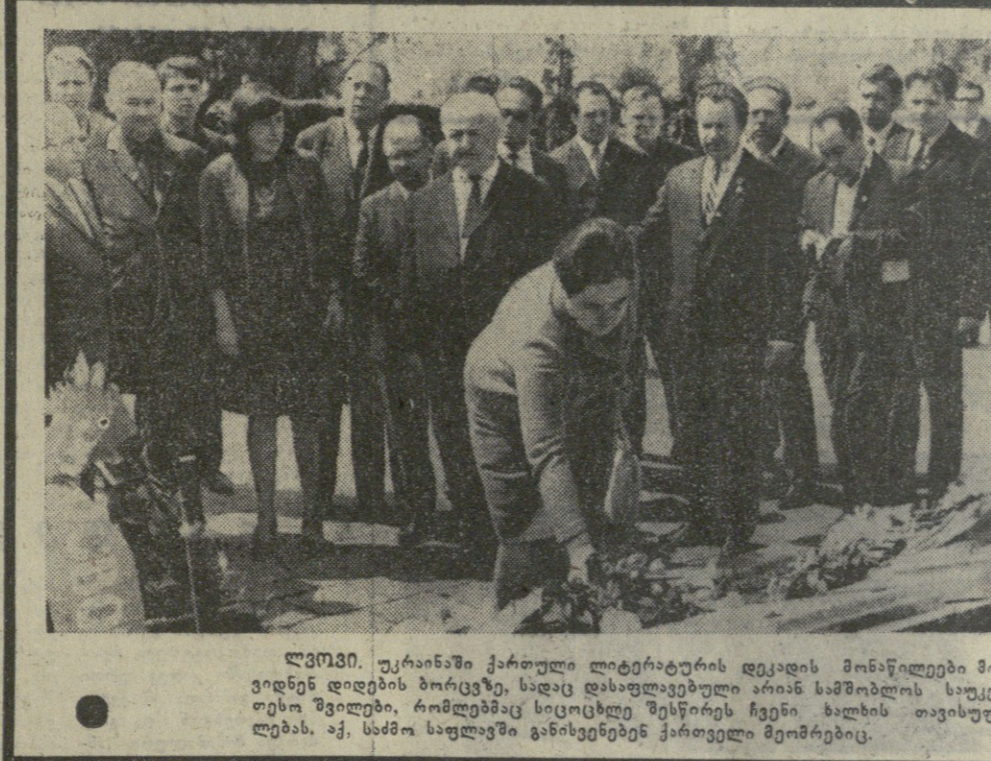
ლევინი, უკრაინაში ქართული ლიტერატურის დეკადის მონაწილეები მივიღებთ დიდებულ მწიგნობარს, სადაც დასრულდა დეკადის მონაწილეობის საუკუნო შედეგი, რომელიც სიციხელ მწიგნობარს ჩვენი ხალხის თავისუფლებას, აქ, სამო საფლავში განსვენებენ ქართველი მწიგნობარები.

არ დამთავრდება, არ დამთავრდება, არც გათავრდება გუბი საგული, ჩვენი სიყვარული გვიდგას თავდებად და სიყვარულის დგას მისაგალი.