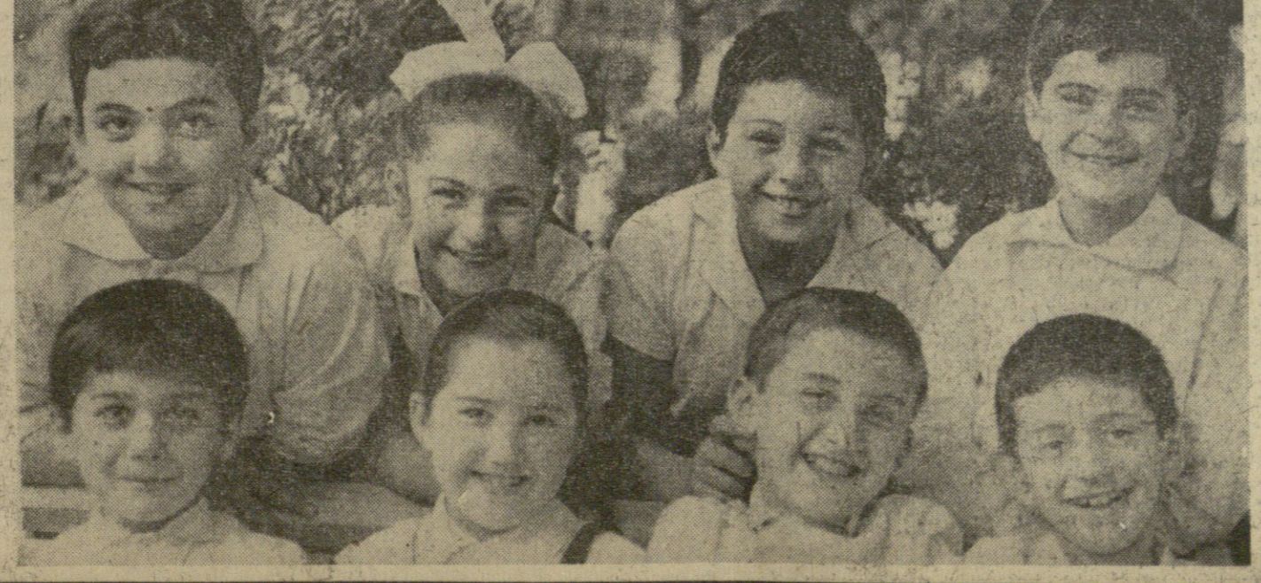
ბავშვების ზრუნვა ჩვენი სოციალისტური საზოგადოების ცხოვრების განუყოფელი და უმნიშვნელო ნაწილია.